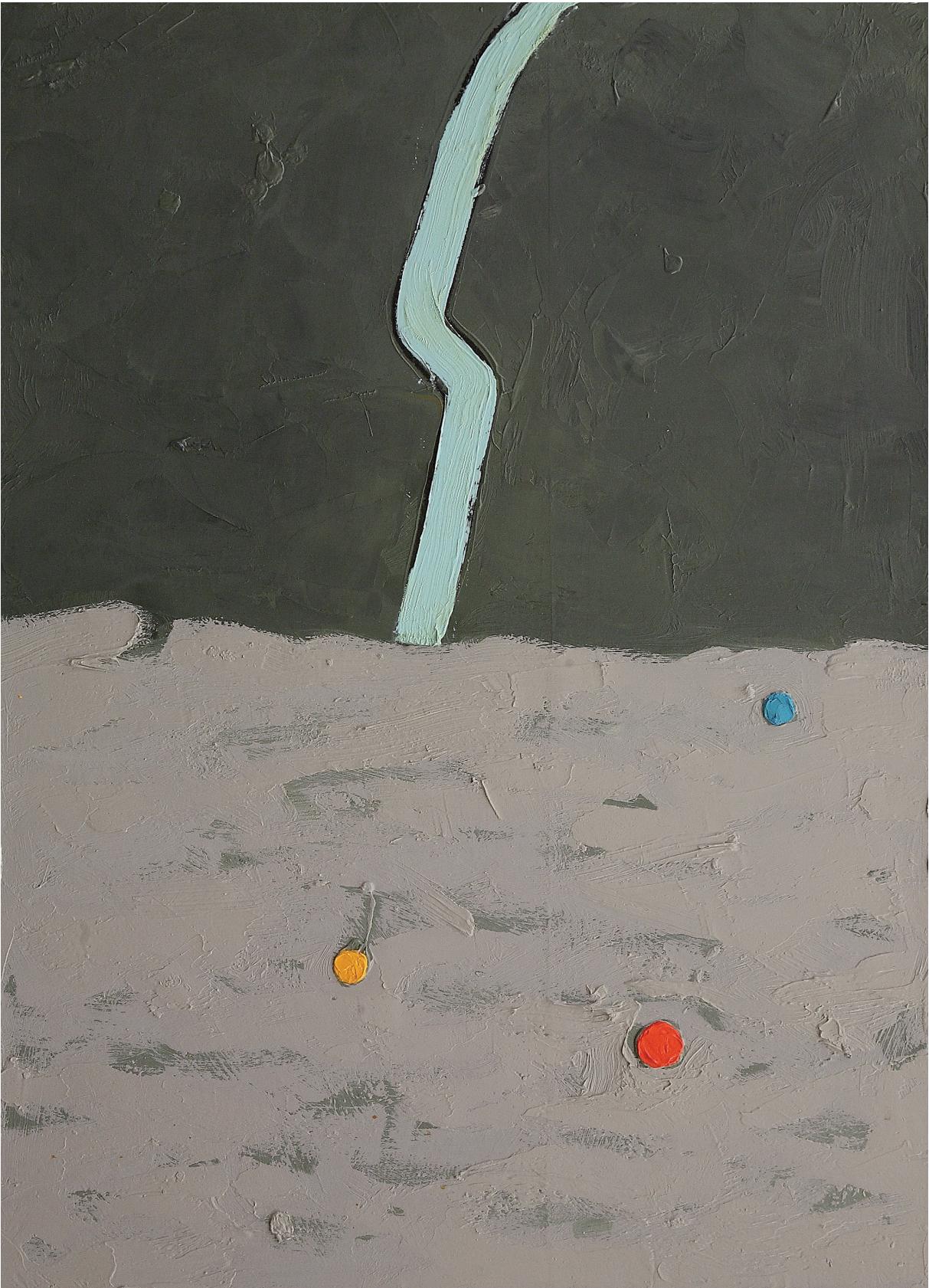
SAETTA AZZURRA olio su tela cm 75x55 (2021)