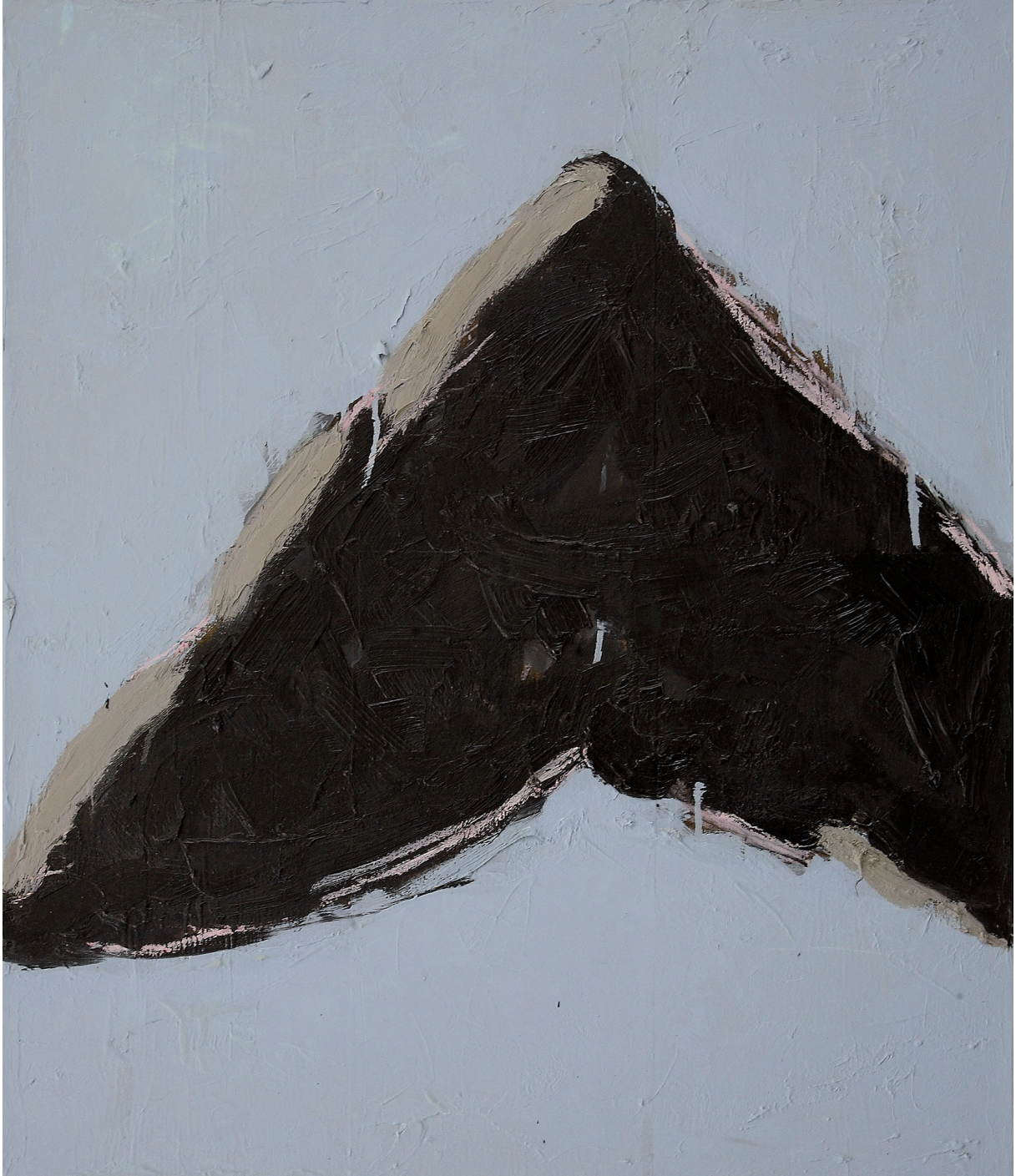
VERTICE olio su tela cm 70x60 (2017)