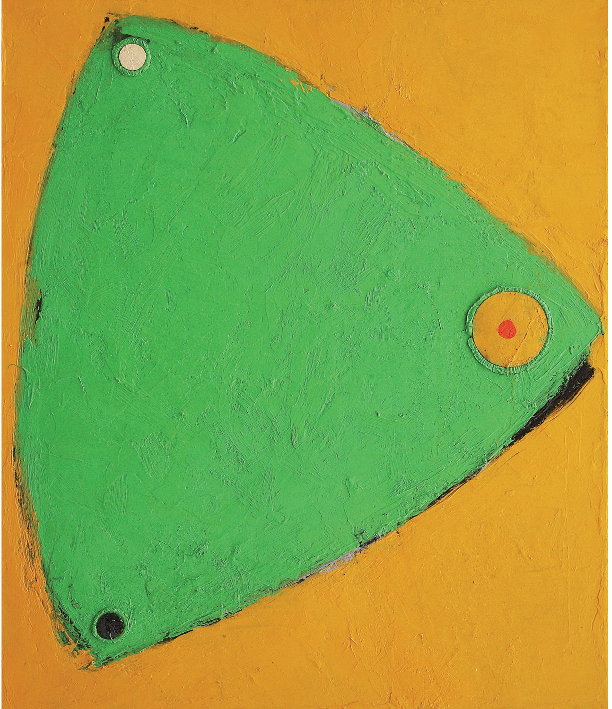
PARTITA FINALE olio su juta cm 70x60 (2021)