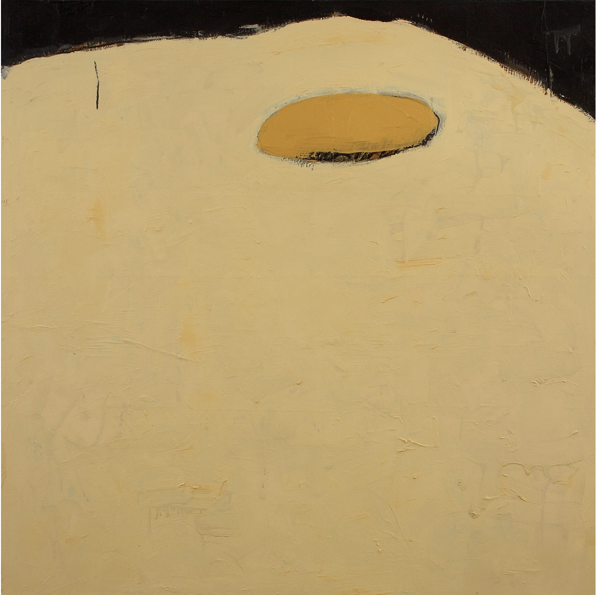
ISOLA D'ORO olio ed oro su tela cm 100x100 (2018)