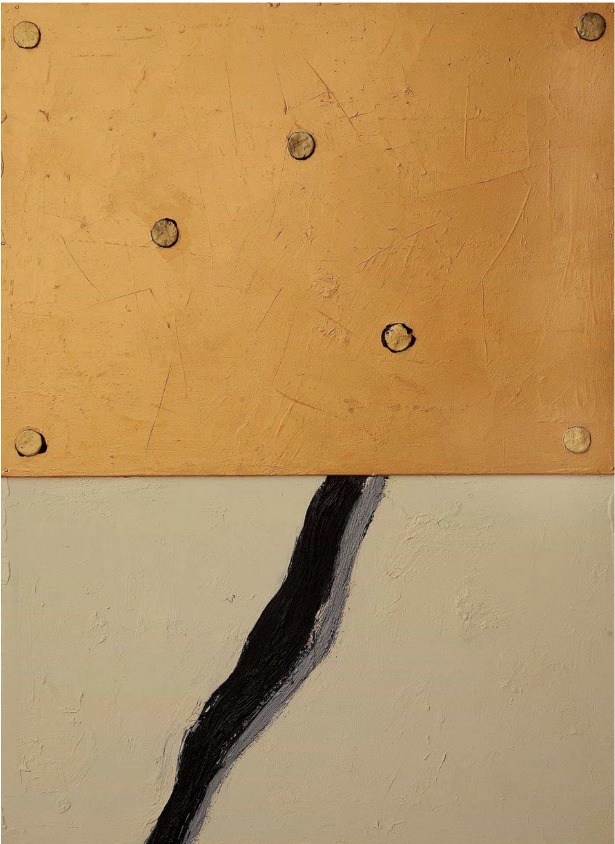
ASSENZA DELLE ATTESE olio su lino ed oro su legno cm 75x55 (2021)