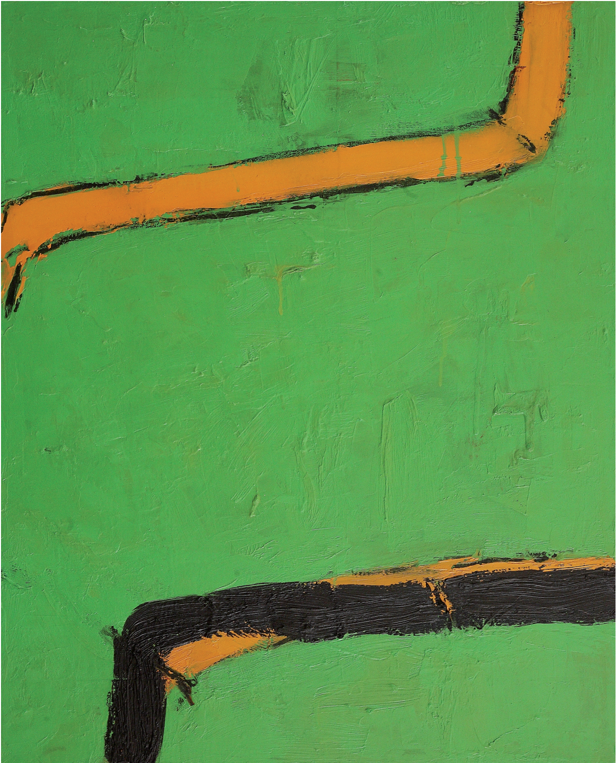
PERCORSI PARALLELI olio su tela cm 75x61 (2020)