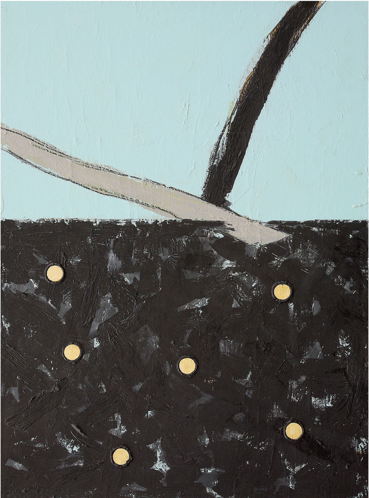
FINIS TERRAE olio su juta cm 80x60 (2019)