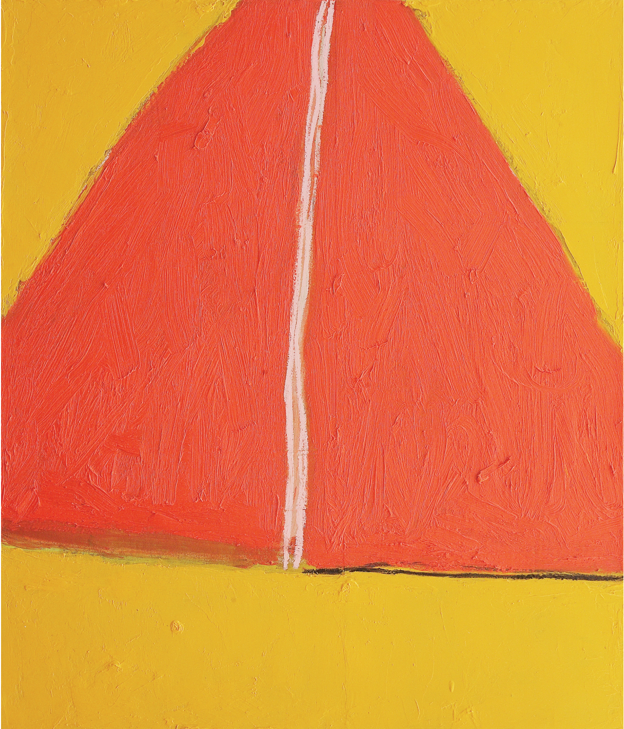
MEZZO DI CONTRASTO olio e pastello su tela cm 70x60 (2021)