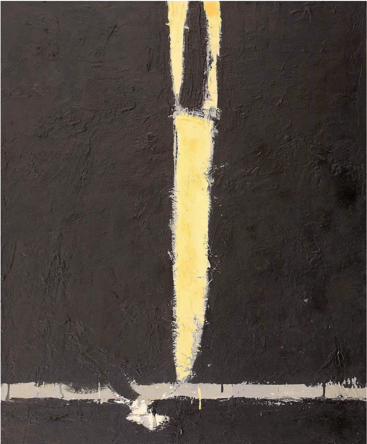
LAMA DI LUCE olio su tela cm 85 x 70 (2018)