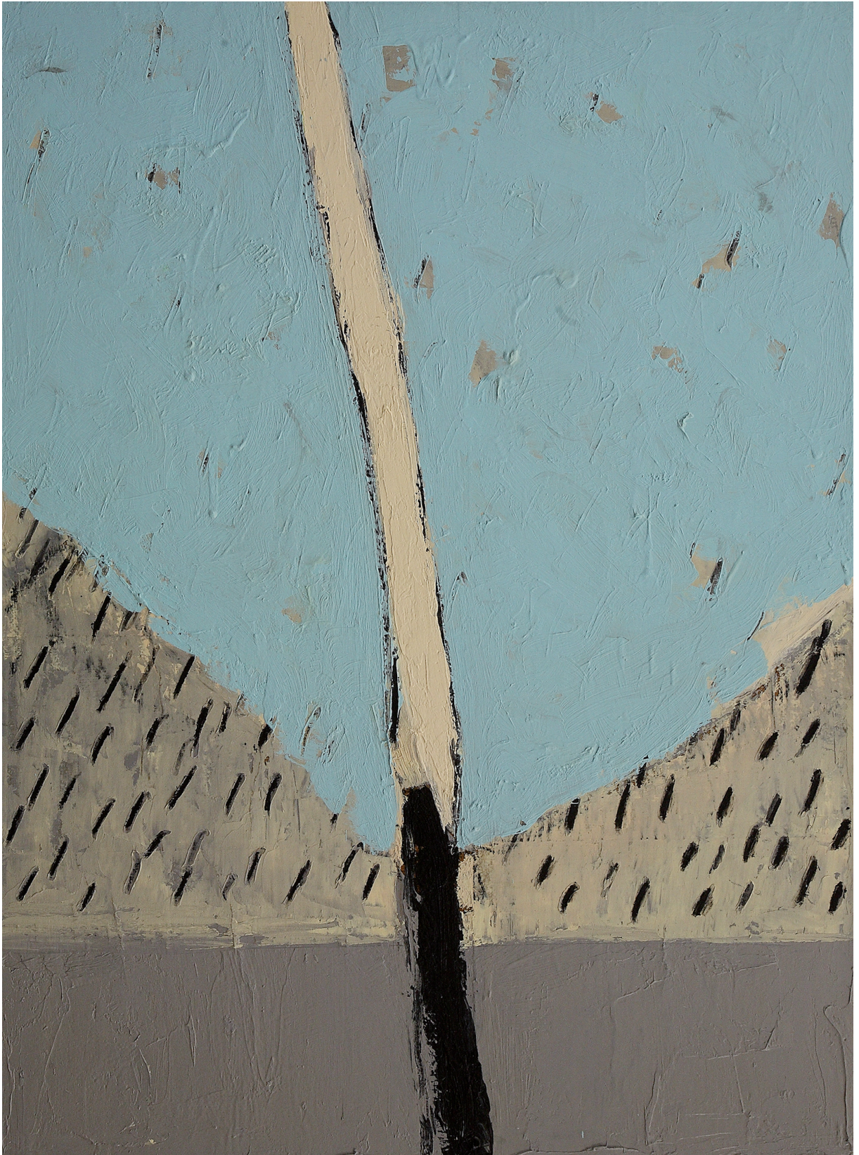
DOVE INIZIA LA VITA olio su juta cm 80x60 (2019)