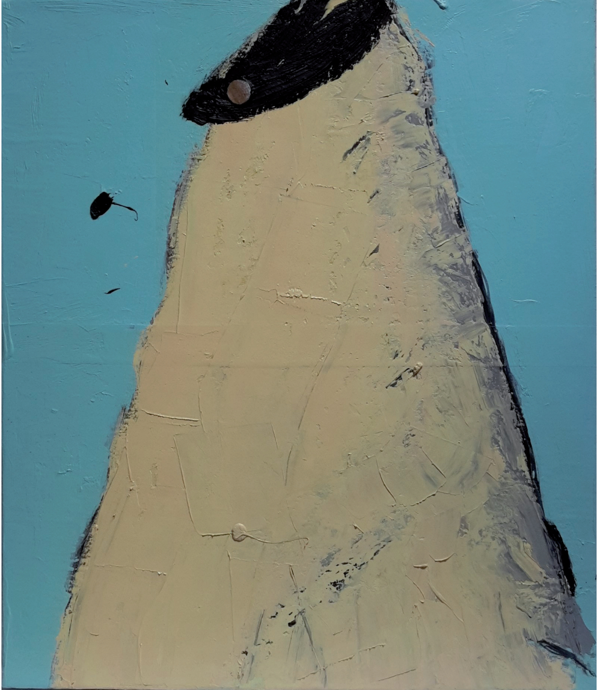
CIÒ CHE RESTA olio su tela cm 70x60 (2023)