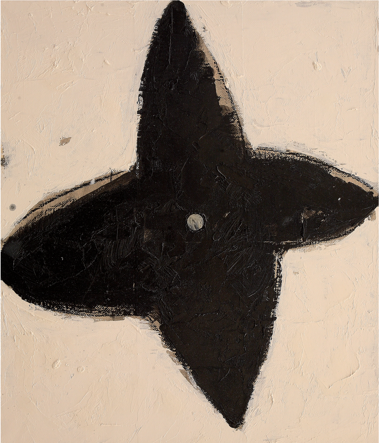
STELLA NERA olio e pastello su juta cm 70x60 (2021)