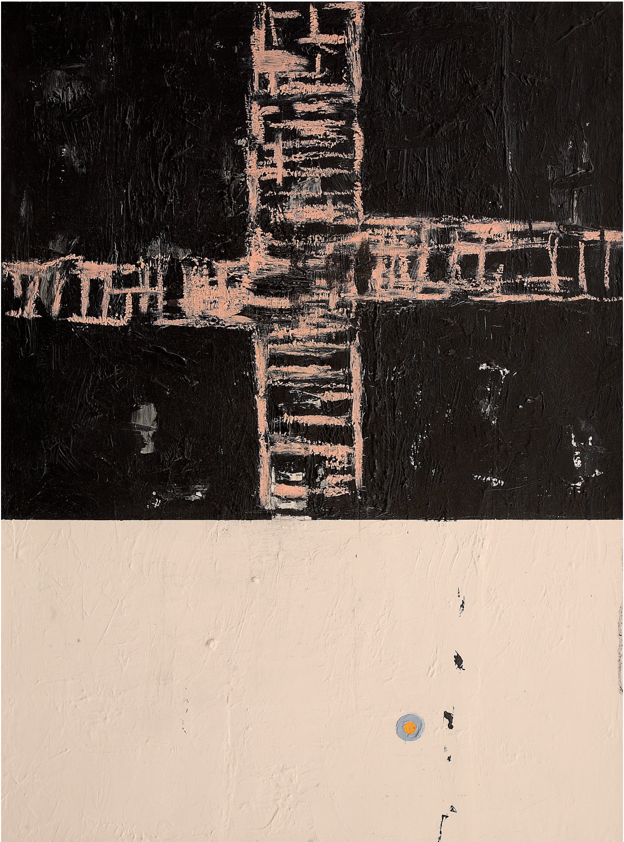
CROCE olio e pastello su juta cm 80x60 (2016)