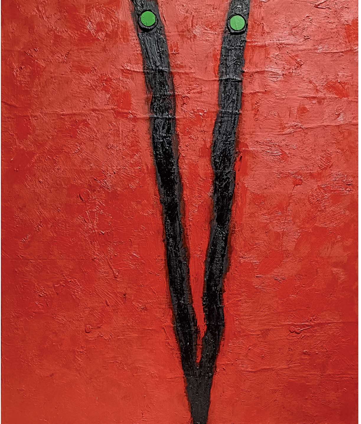
MALVOLIO olio su juta cm 77x64 (2023)