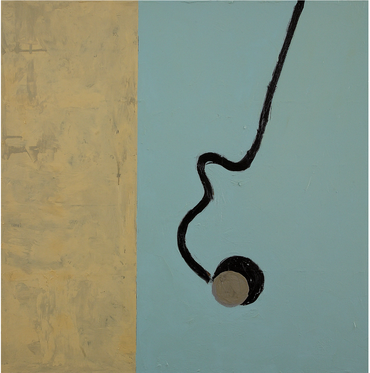
AL LIMITE olio su tela cm 80x80 (2019)