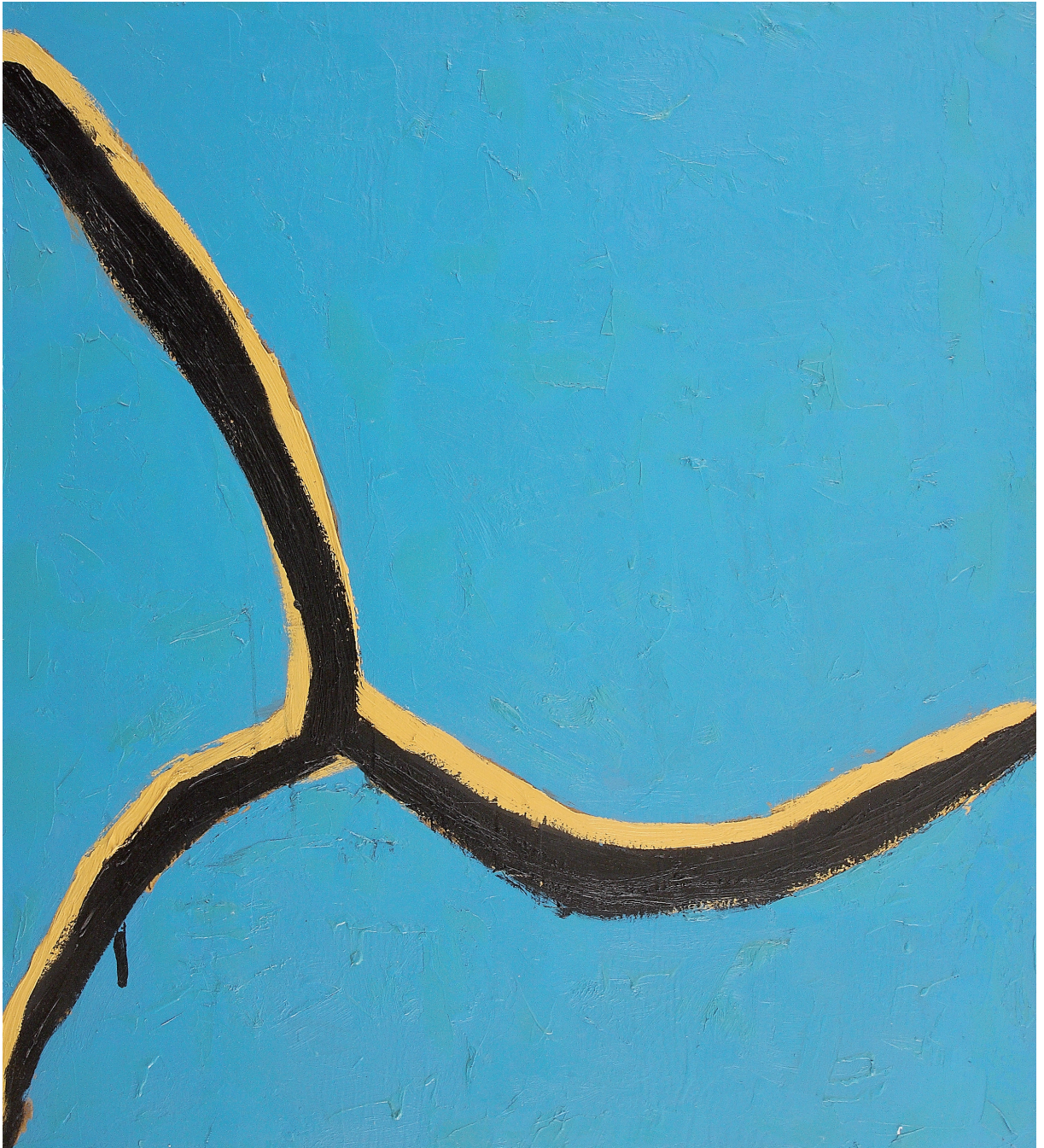
TRIVIO II olio su tela cm 110x100 (2020)