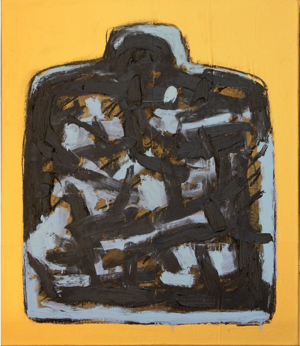
ICONA RIBELLE olio ed oro su tela cm 70x60 (2016)