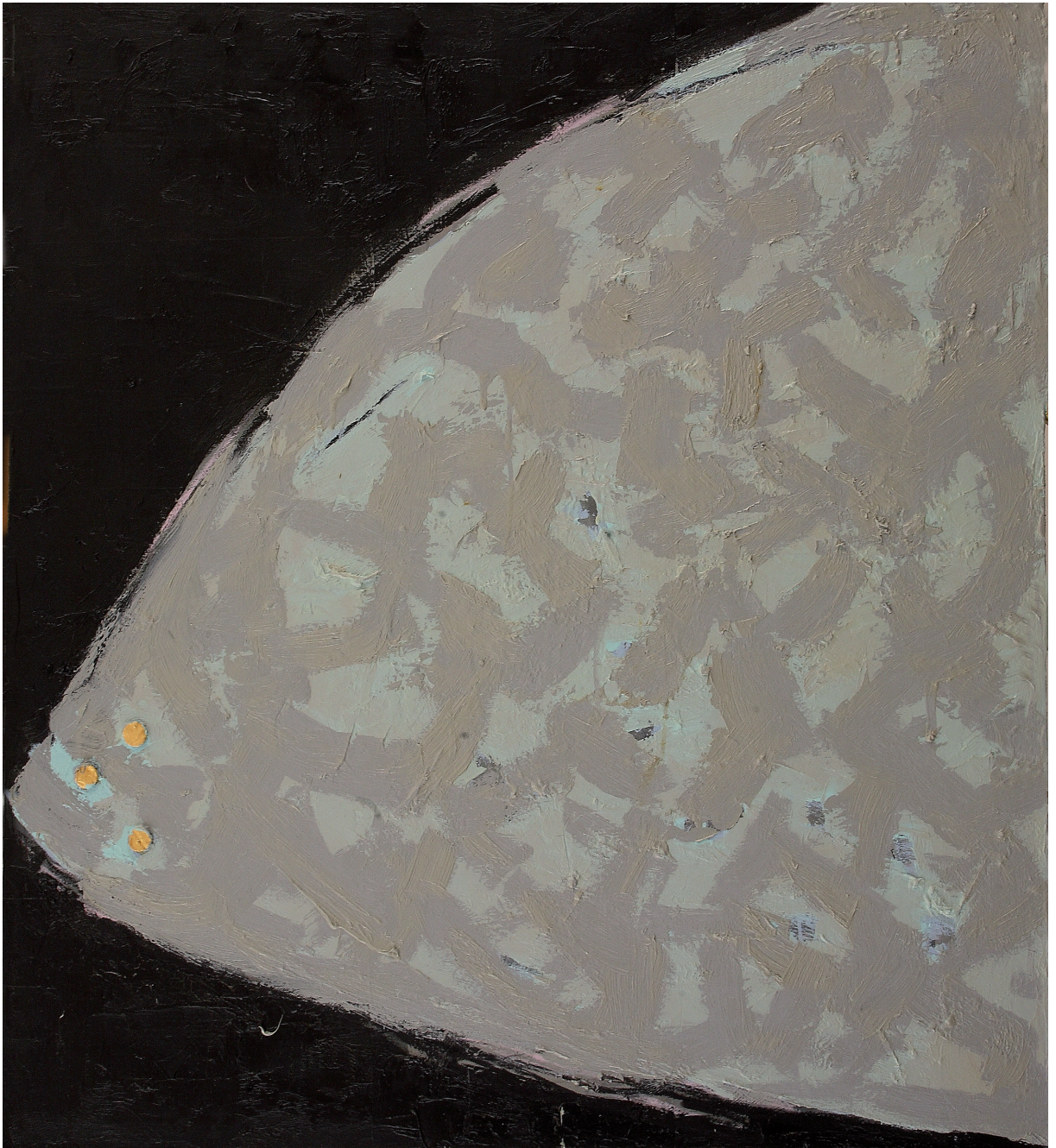
PUNTI D'ORO olio e pastello su juta cm 100x90 (2017)