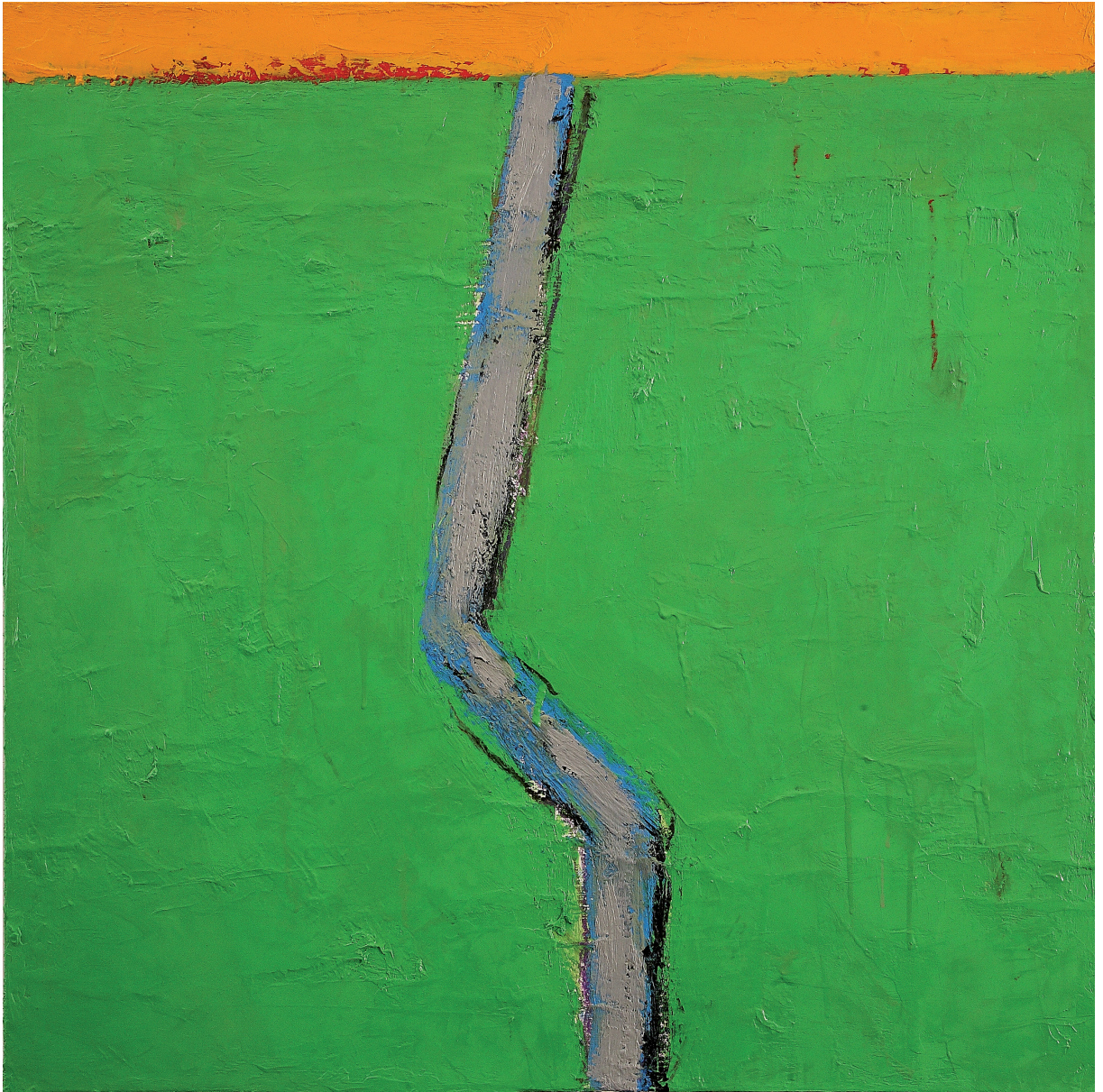
LA SILENZIOSA ELOQUENZA olio su juta cm 80x80 (2022)