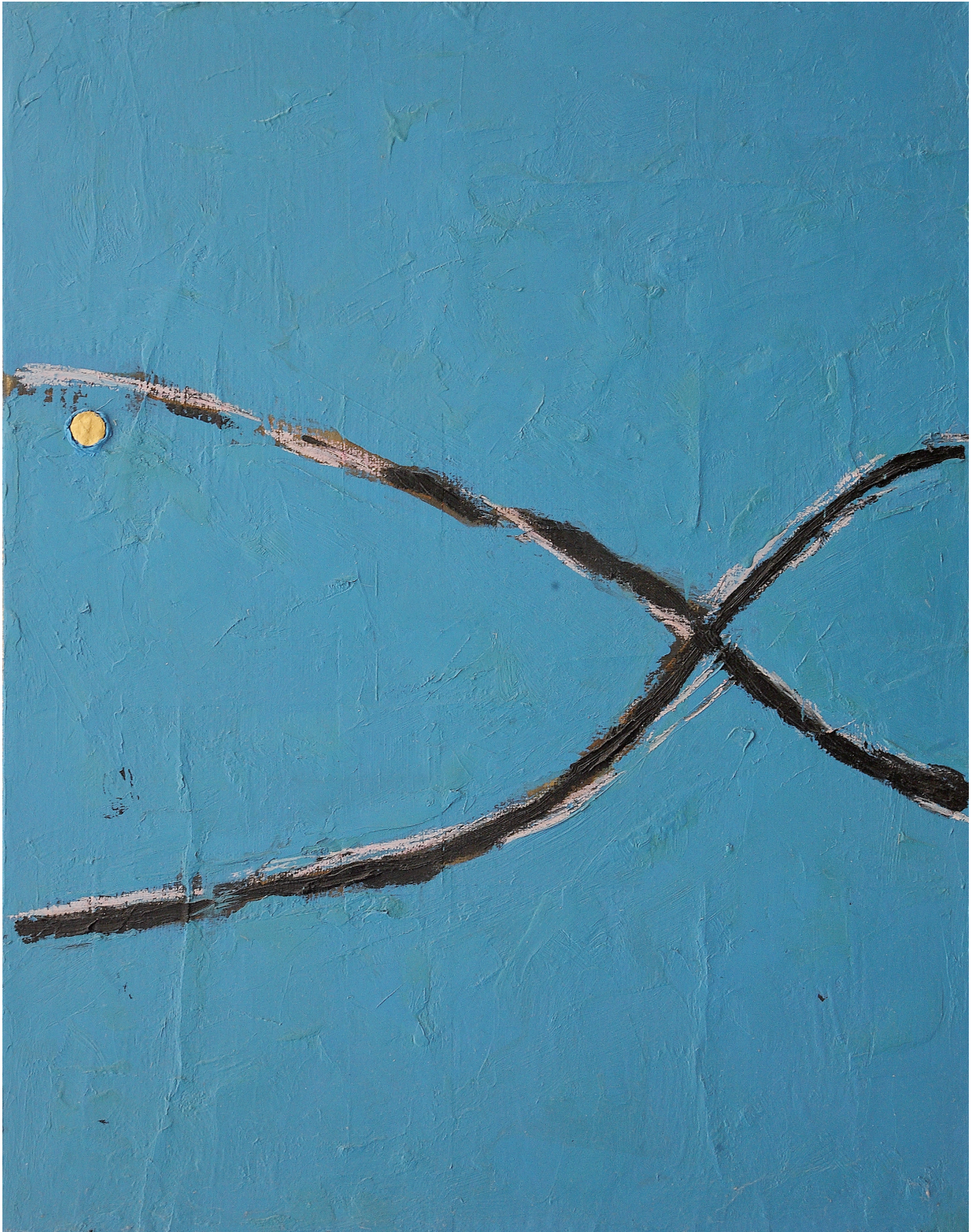
SENZA TITOLO olio e pastello su juta cm 74x58 (2018)