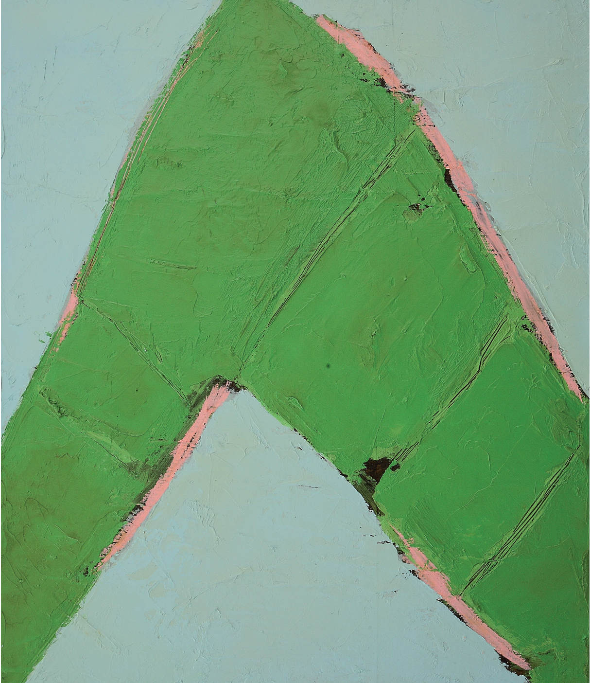
VERDE INFINITO olio e pastello su tela cm 70x60 (2018)