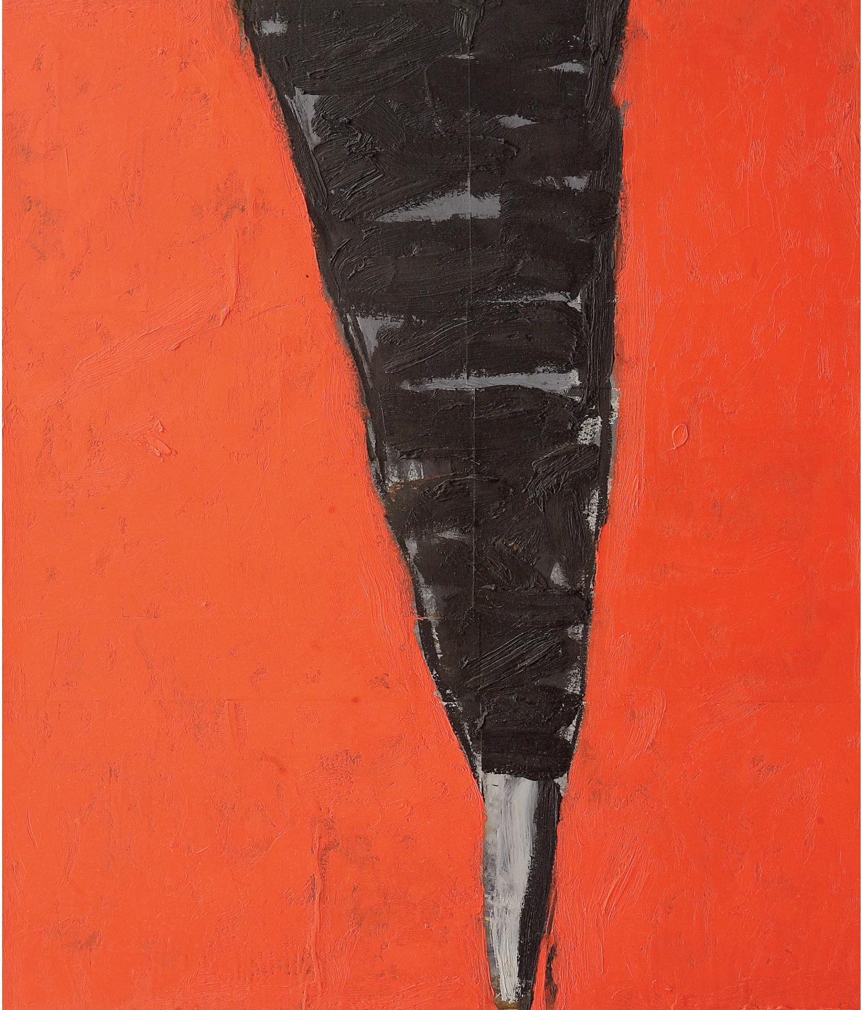
FOSSO BANDITO olio su tela cm 70x60 (2021)