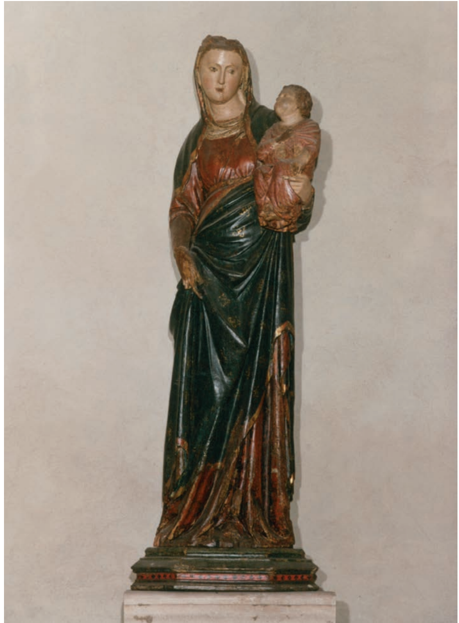
Madonna con Bambino, Mariano d'Agnolo Romanelli (attr.), fine sec. XIV (Concattedrale di S. Antimo Martire)