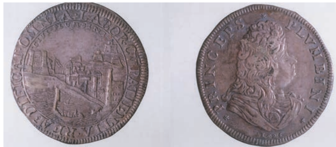
Piastra, AR – Fronte/retro (Giovanni Battista Ludovisi, 1695)

(AA.VV., Le monete di Piombino: dagli etruschi ad Elisa Baciocchi , Pacini Editore, Ospedaletto, PI, 1987, p. 70 e seg.)