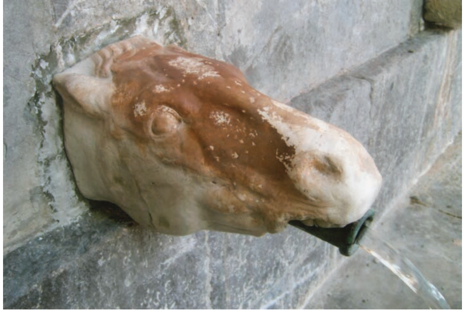
Testa di Cavallo, Fonte di Marina o dei Canali, Nicola Pisano, 1248