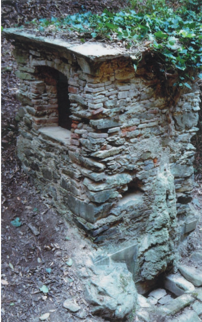
Fonte del soldato