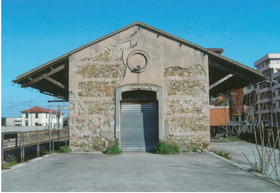
Deposito merci della Stazione FFSS., anni '20 del '900