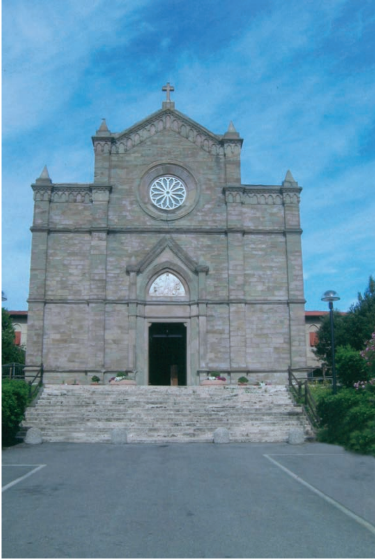
Chiesa della Immacolata Concezione e S. Cerbone, Attilio Razzolini, 1902