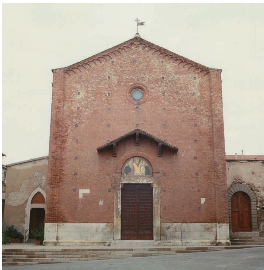
Concattedrale di S. Antimo Martire, 1377