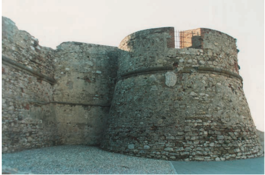
Torrione rotondo, fortezza medicea, Giovanni Camerini, metà sec. XVI