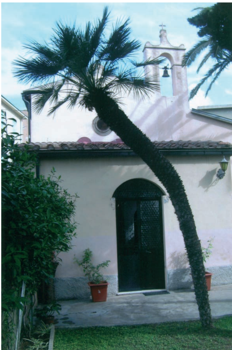
Chiesa della Madonna del Desco, sec. XV