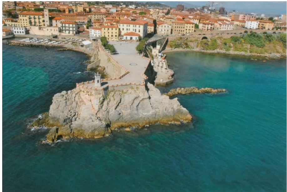
Piazza Giovanni Bovio

nazione, restauro delle banchine, nuova pavimentazione, e la collocazione in posizione centrale di una Rosa dei Venti in marmi policromi con l'indicazione dei venti. Una decisione apparentemente di poca importanza, ma che ha dato uniformità alla piazza, è stata quella di eliminare i quattro vecchi tamerici centrali, residuo dell'antica divisione della Piazza; piante sostituite con altre in posizione più opportuna.