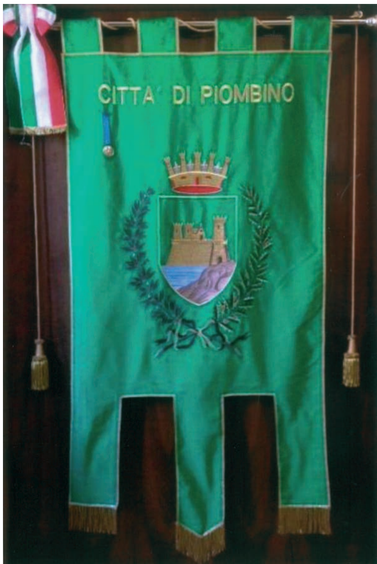
Gonfalone della Città di Piombino, con la Medaglia d'Oro al Valor Militare