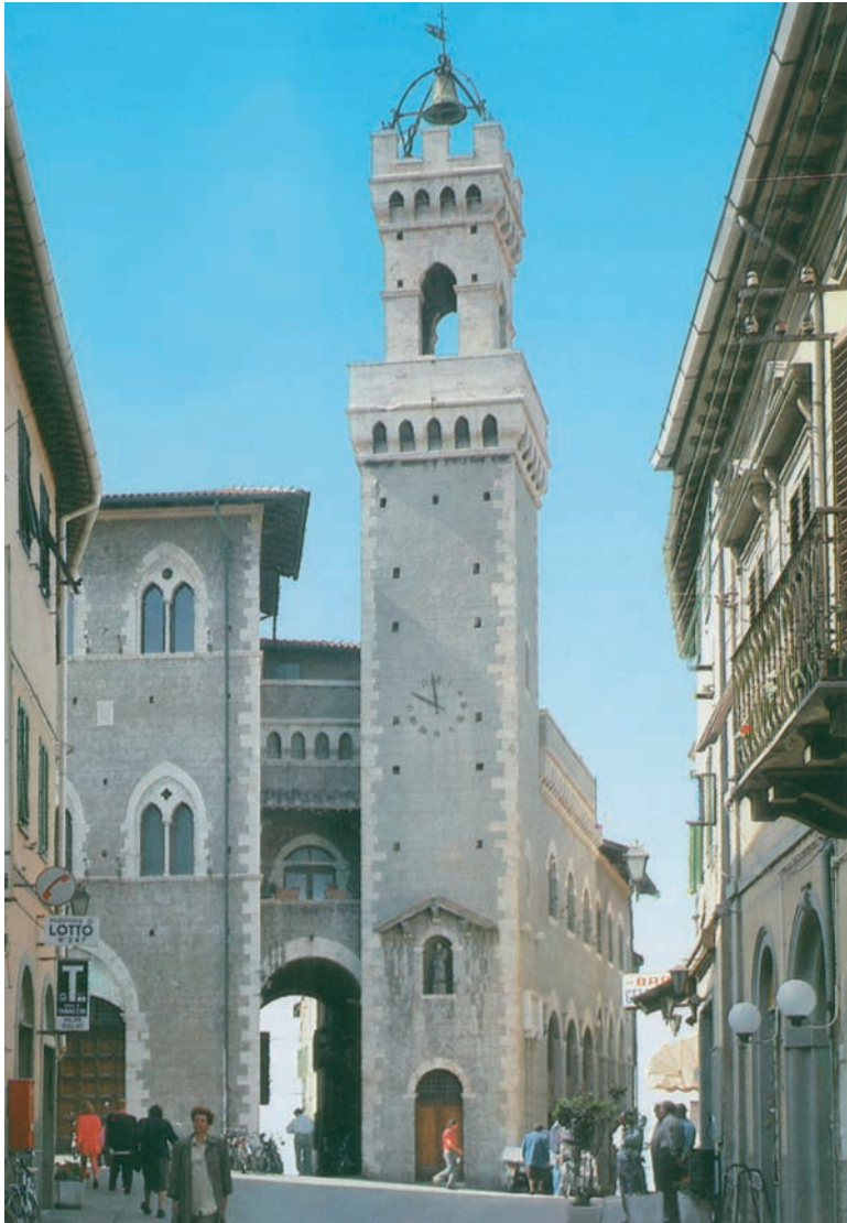
Palazzo Comunale, dopo il restauro del 1933/35