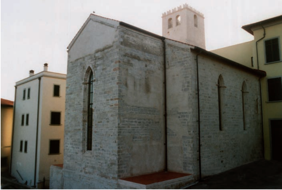
Ex Chiesa di S. Antimo sopra i Canali, metà sec. XIII