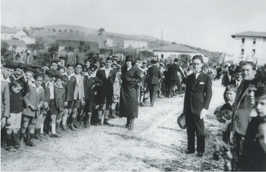
Parco delle Rimembranze – Inaugurazione del 4 novembre 1923