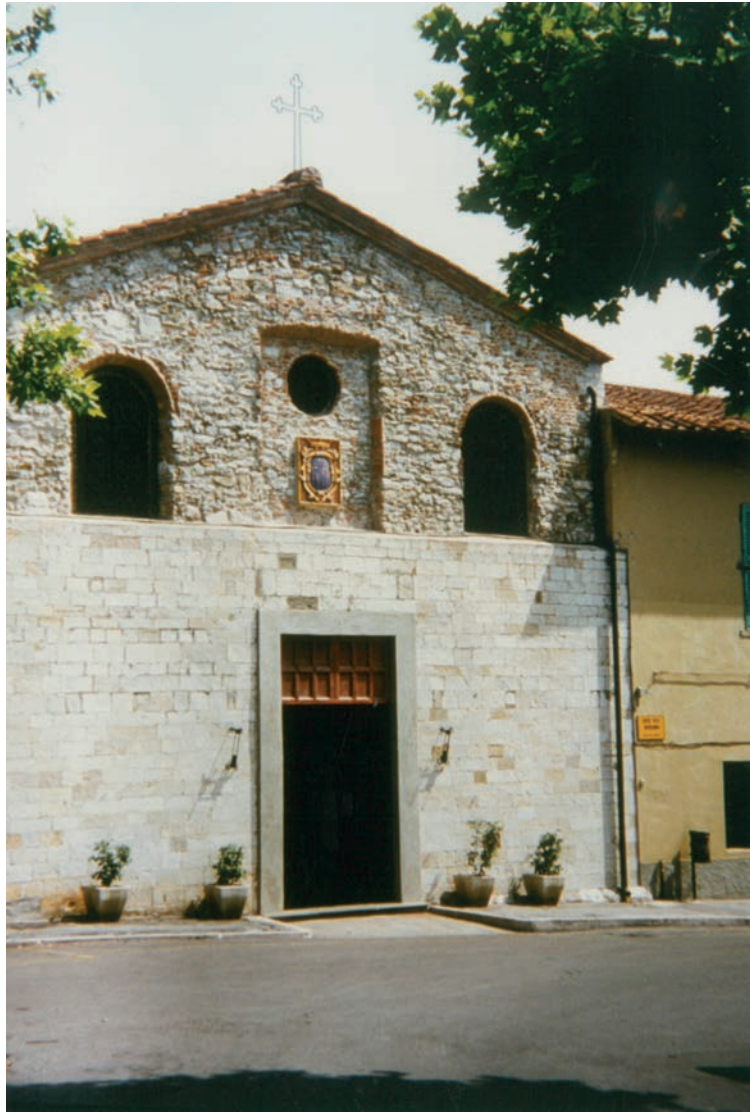
Chiesa di S. Giovanni Battista o della Misericordia, sec. XVI