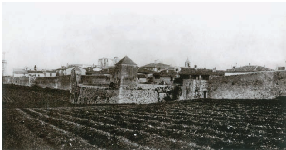
Piombino, vista prospettica dal mare, Pierre Mortier, 1647