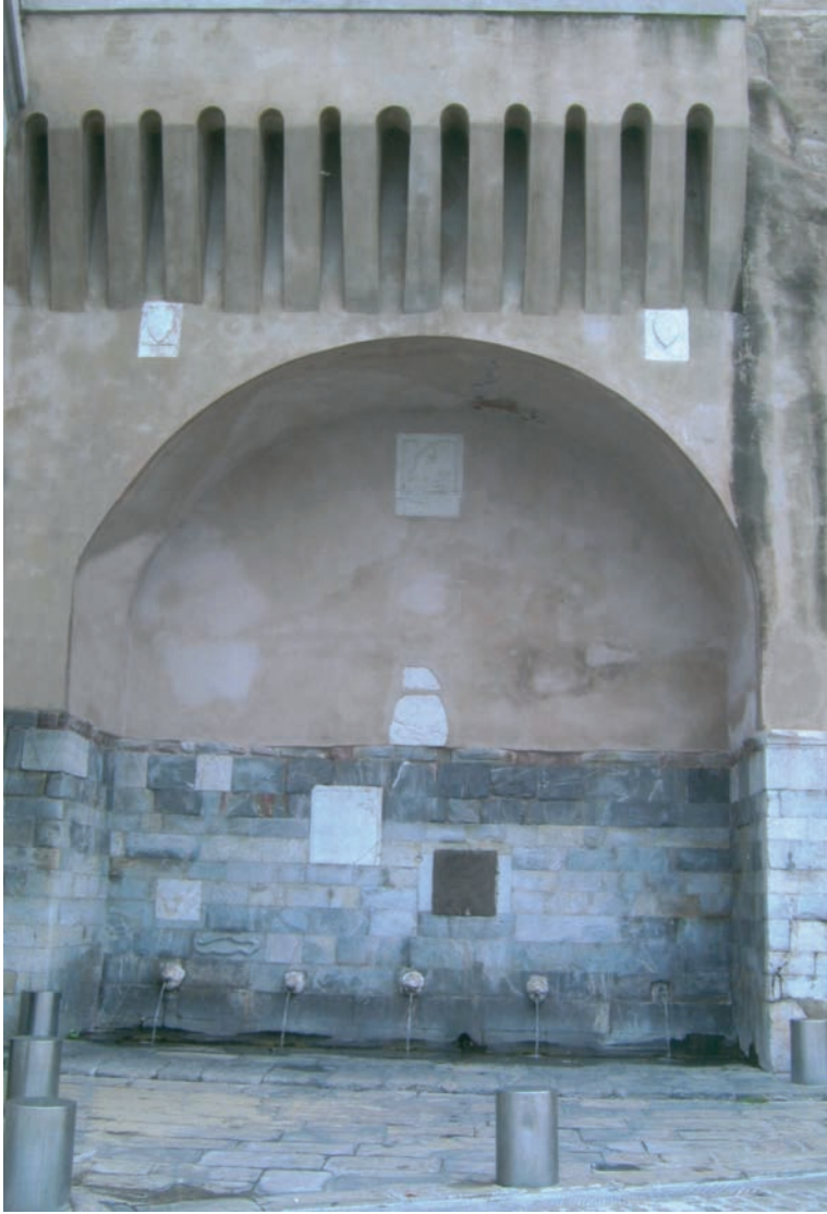
Fonte di Marina o dei Canali, 1248