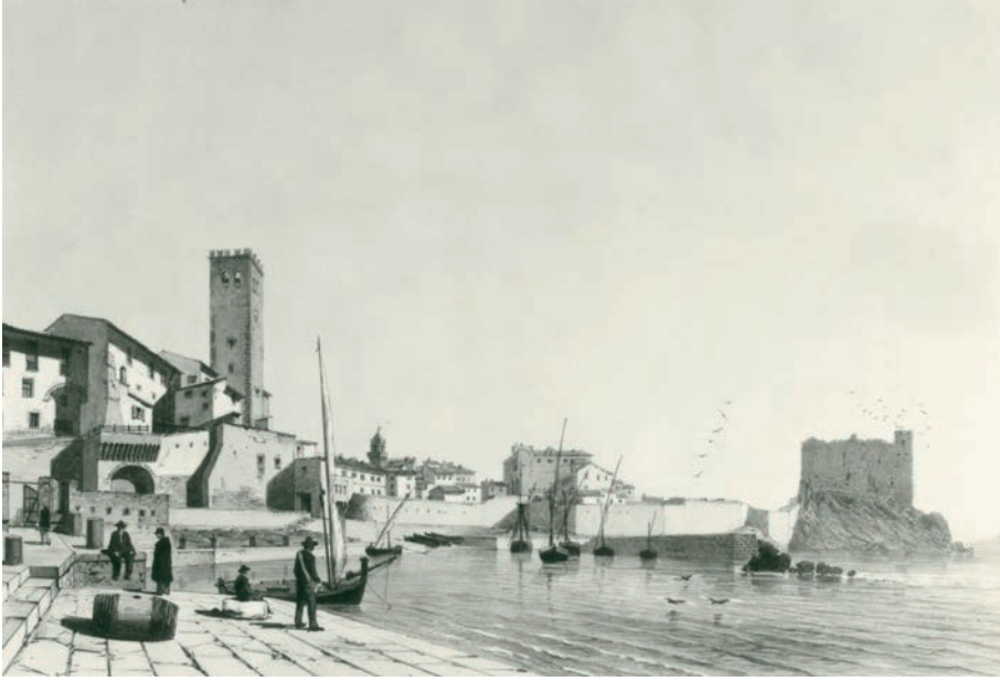
Antico porto di Piombino, 1863 (litografia, Durand/Ciceri)