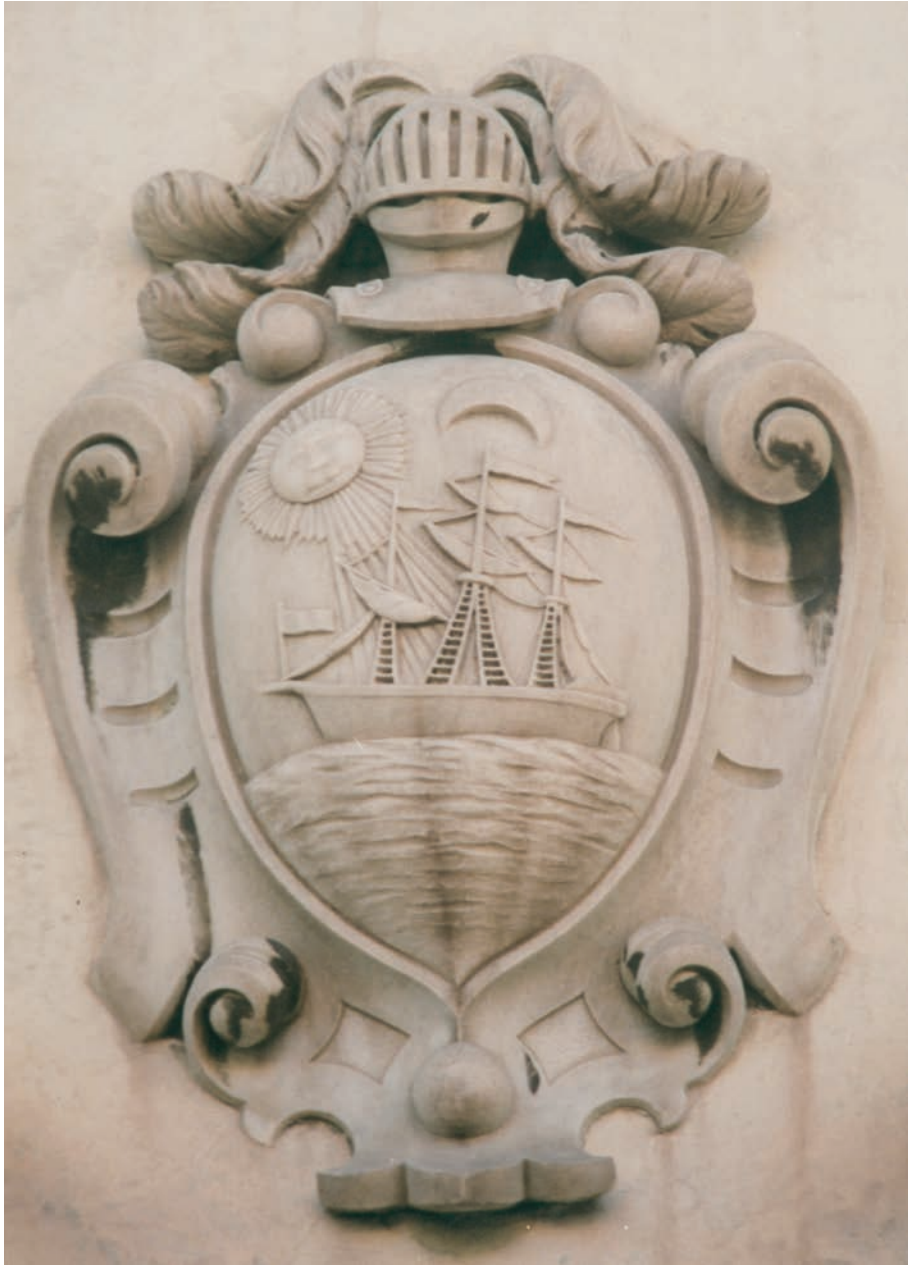
Stemma Maresma, sec. XVIII, palazzo Corso Vittorio Emanuele II