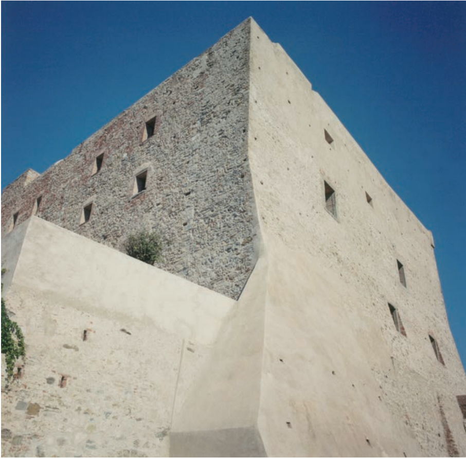
Castello, sec. XIII/XVI