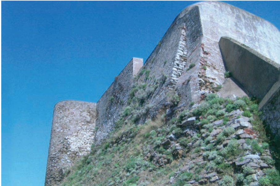
Mura del fronte di terra, dalla piattaforma medicea alla Cittadella, sec. XV