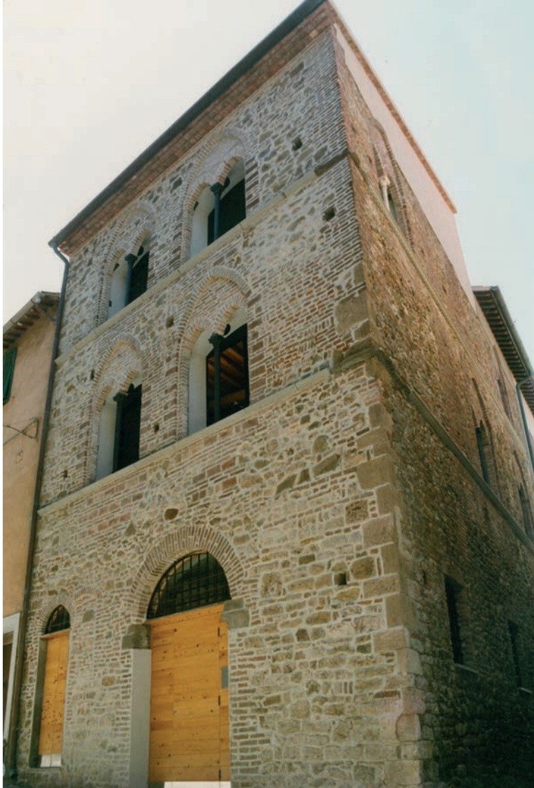
Casa delle Bifore, casa torre del sec. XIV