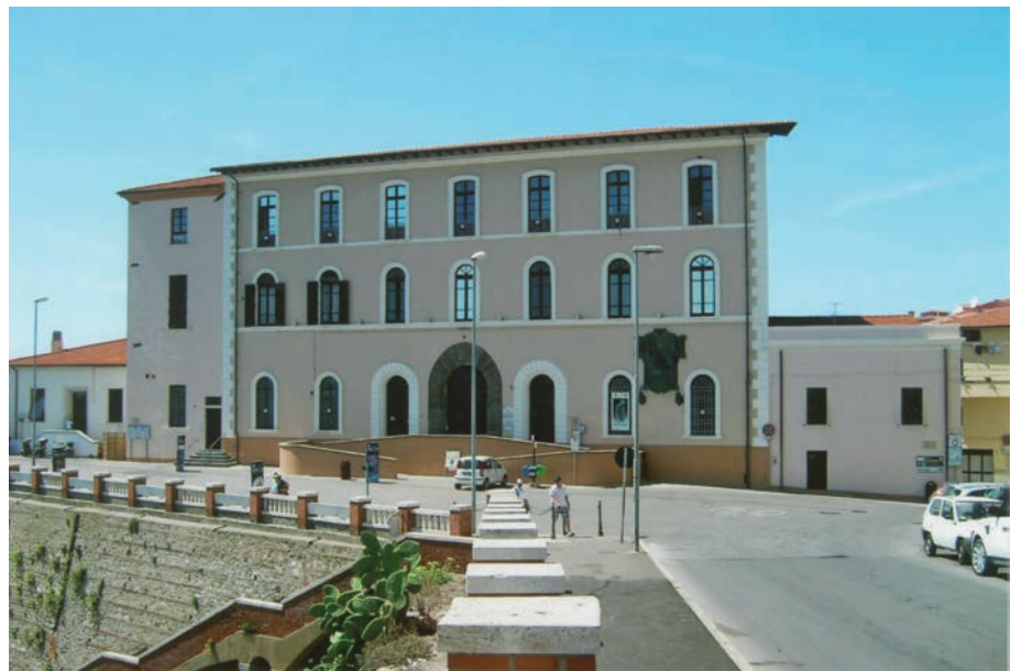
Palazzo Appiani alla Piazzarella

Lungo le scale, tra il secondo ed il terzo piano, nel 1918 fu murata una lapide di marmo per ricordare Ferruccio Niccolini, al quale fu intitolata la scuola tecnica. Ingegnere capo del Comune di Piombino, morì il 15 ottobre 1915 mentre nel suo ufficio stava definendo una relazione sulla trasformazione del servizio della pubblica illuminazione della Città. Esponente del socialismo nazionale e della massoneria; sotto il bassorilievo del busto del Niccolini, si vedono incisi il compasso e la squadra, simboli della massoneria stessa.