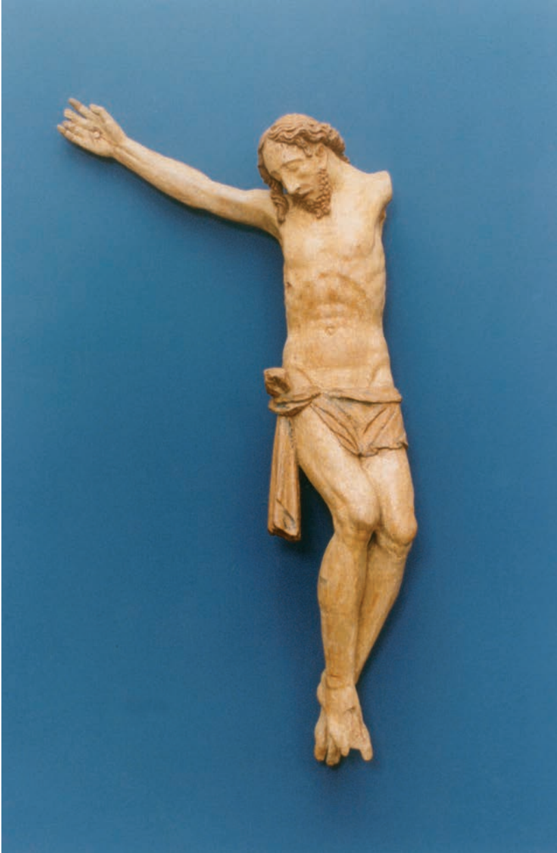
Crocifisso, terza decade sec. XVI (Museo della Concattedrale di S. Antimo Martire)