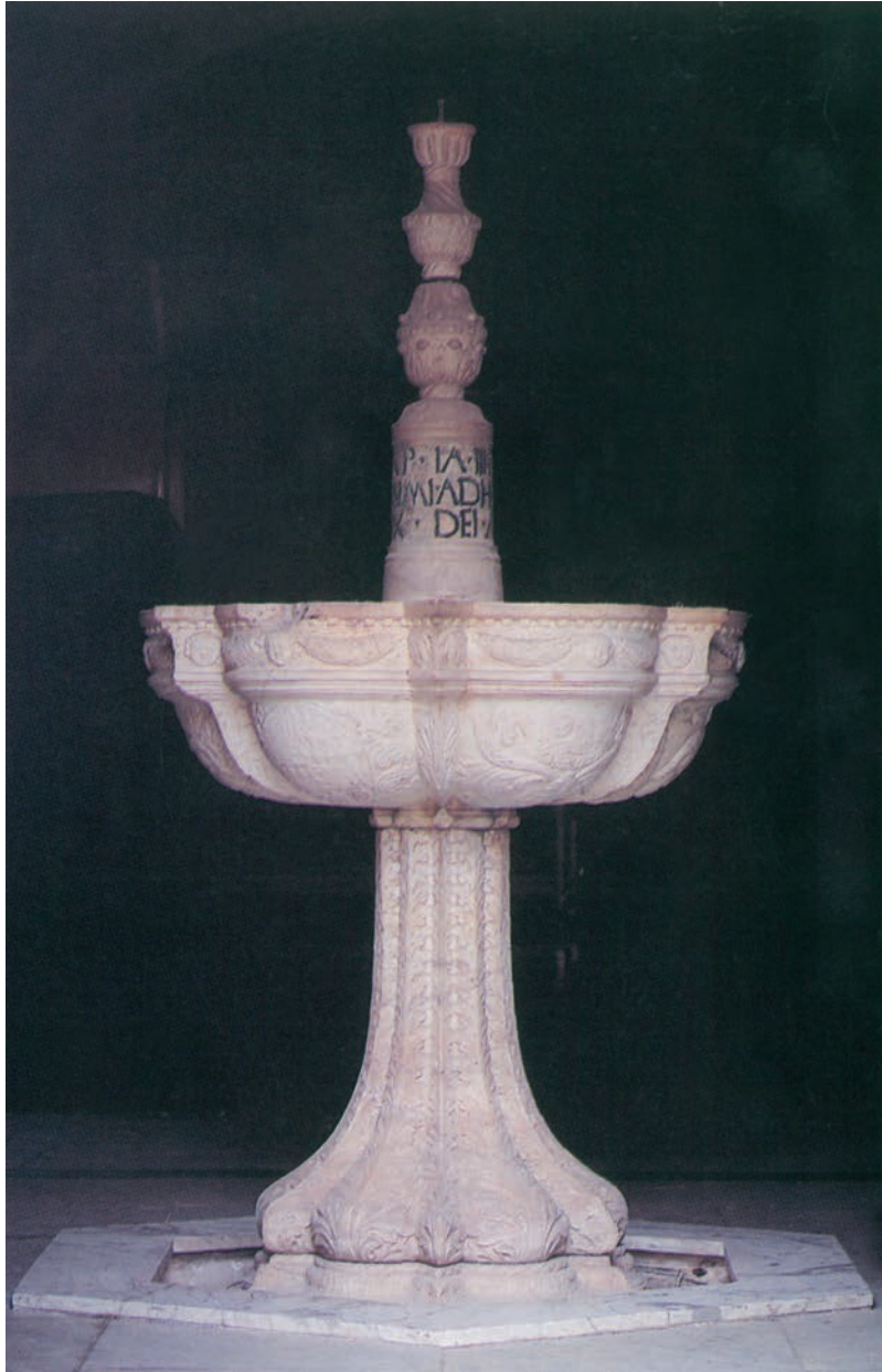
Fonte battesimale, Andrea di Francesco Guardi, 1470 (Concattedrale di S. Antimo Martire)