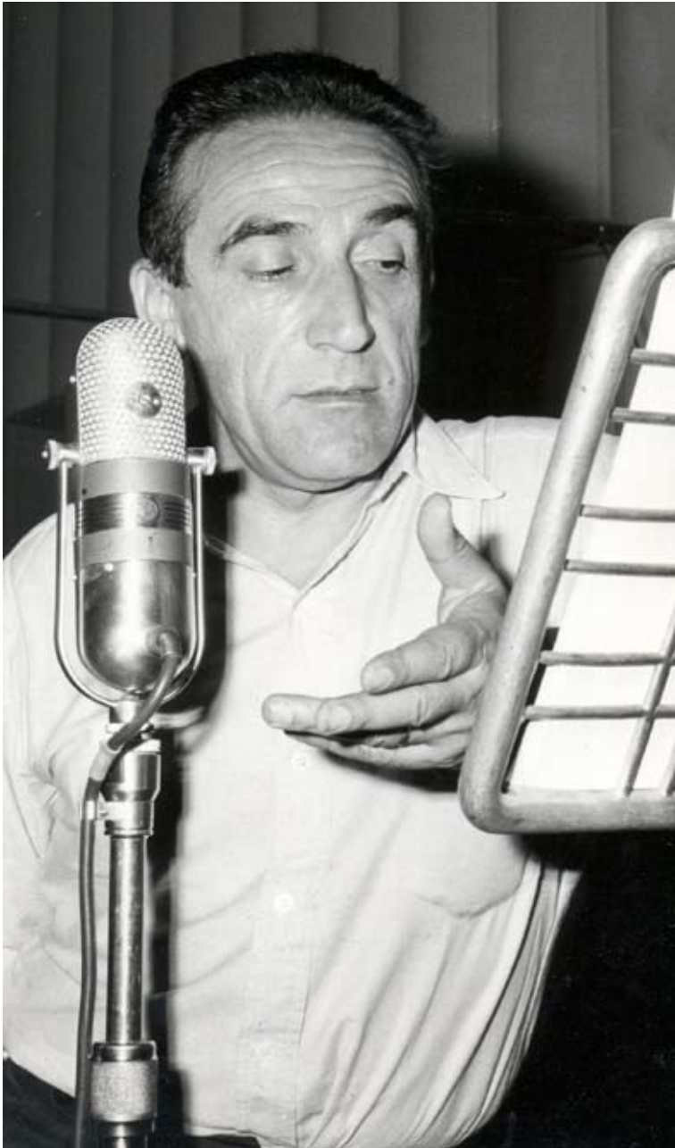
3. Arnoldo Foà, 1964