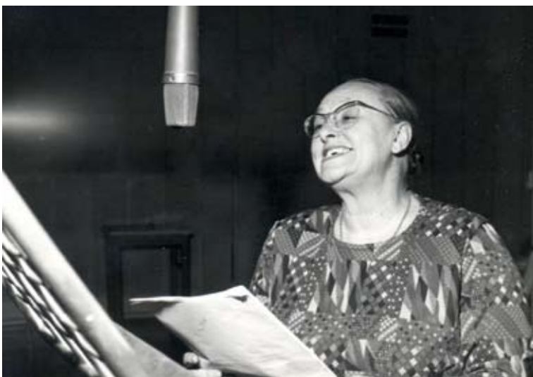
6. Ave Ninchi, 1970