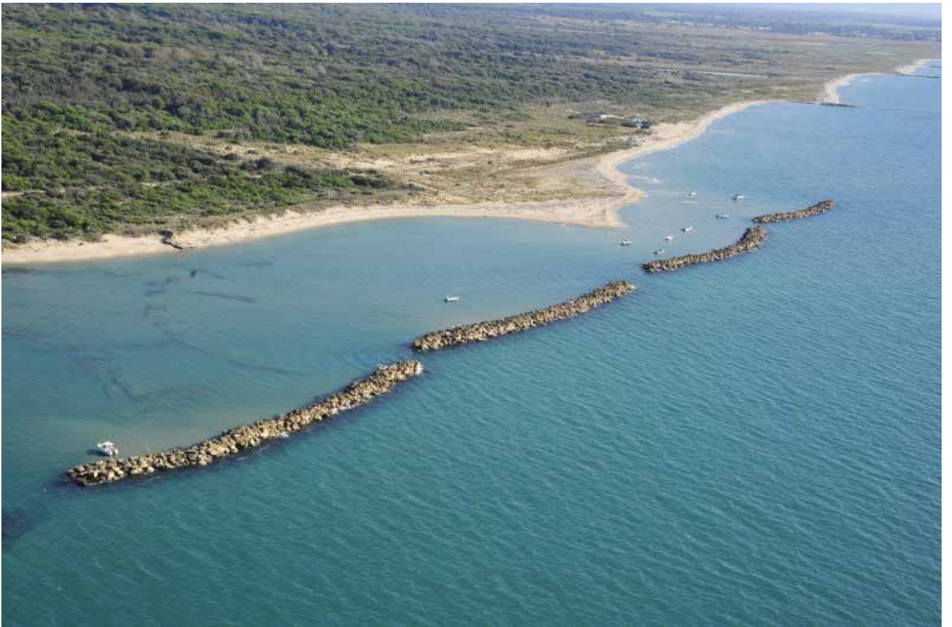
Il Gombo – San Rossore (Pi)