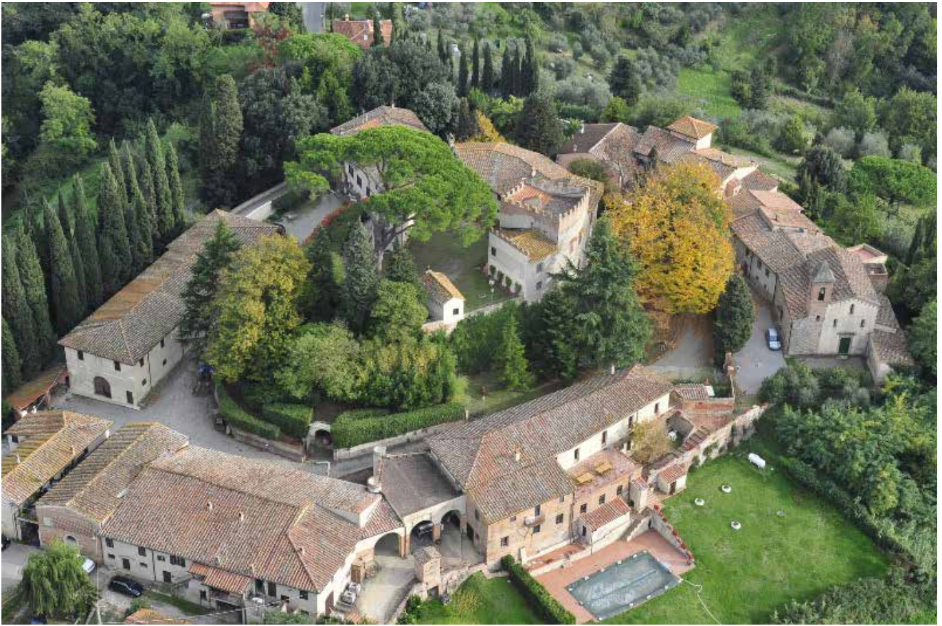
San Gervasio – Palaia (Pi)