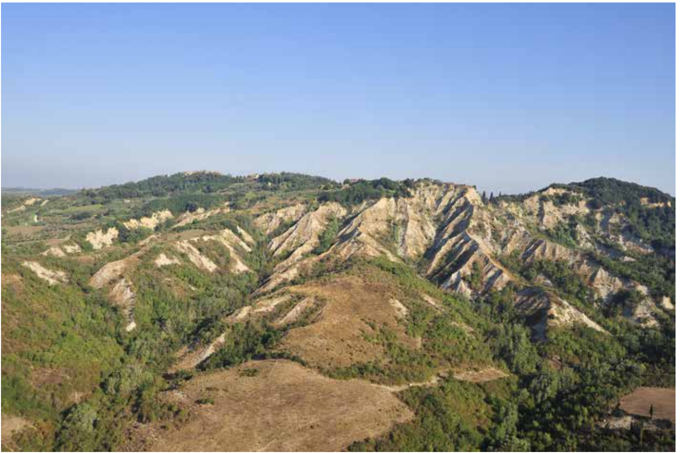
I Calanchi – Toiano (Pi)