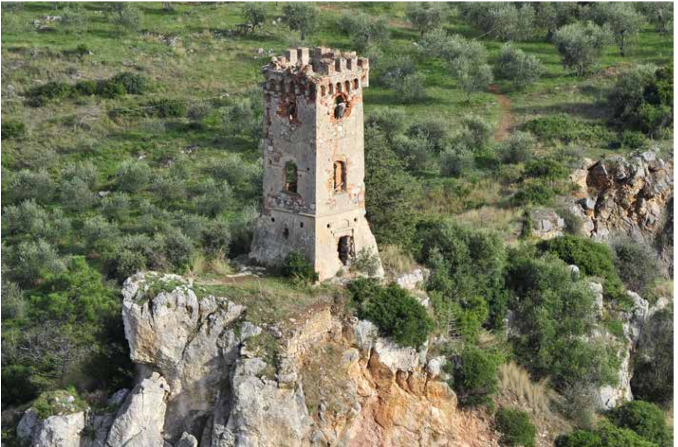
Torre degli Uppezzinghi – Caprona (Pi)