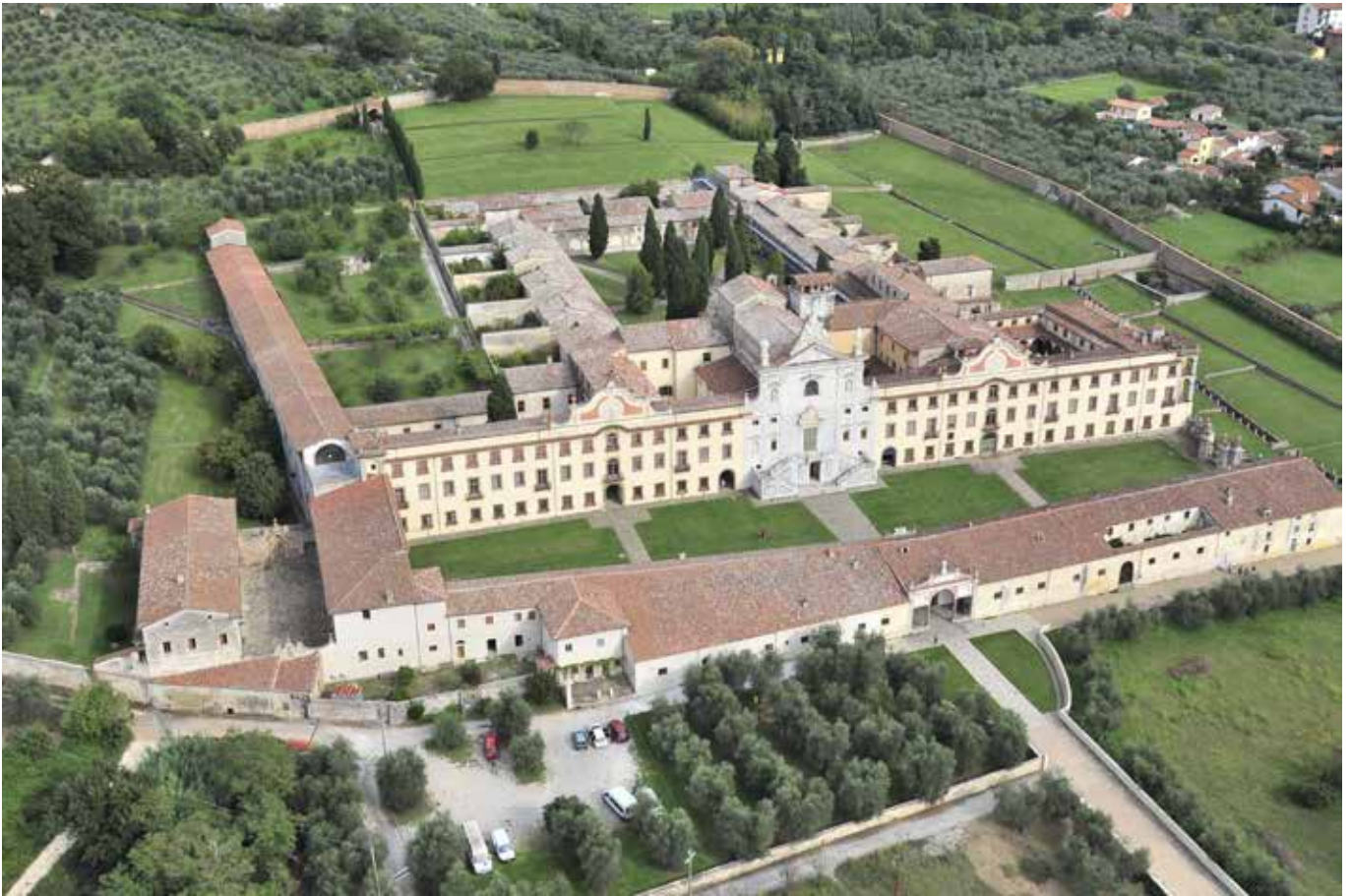
La Certosa – Calci (Pi)