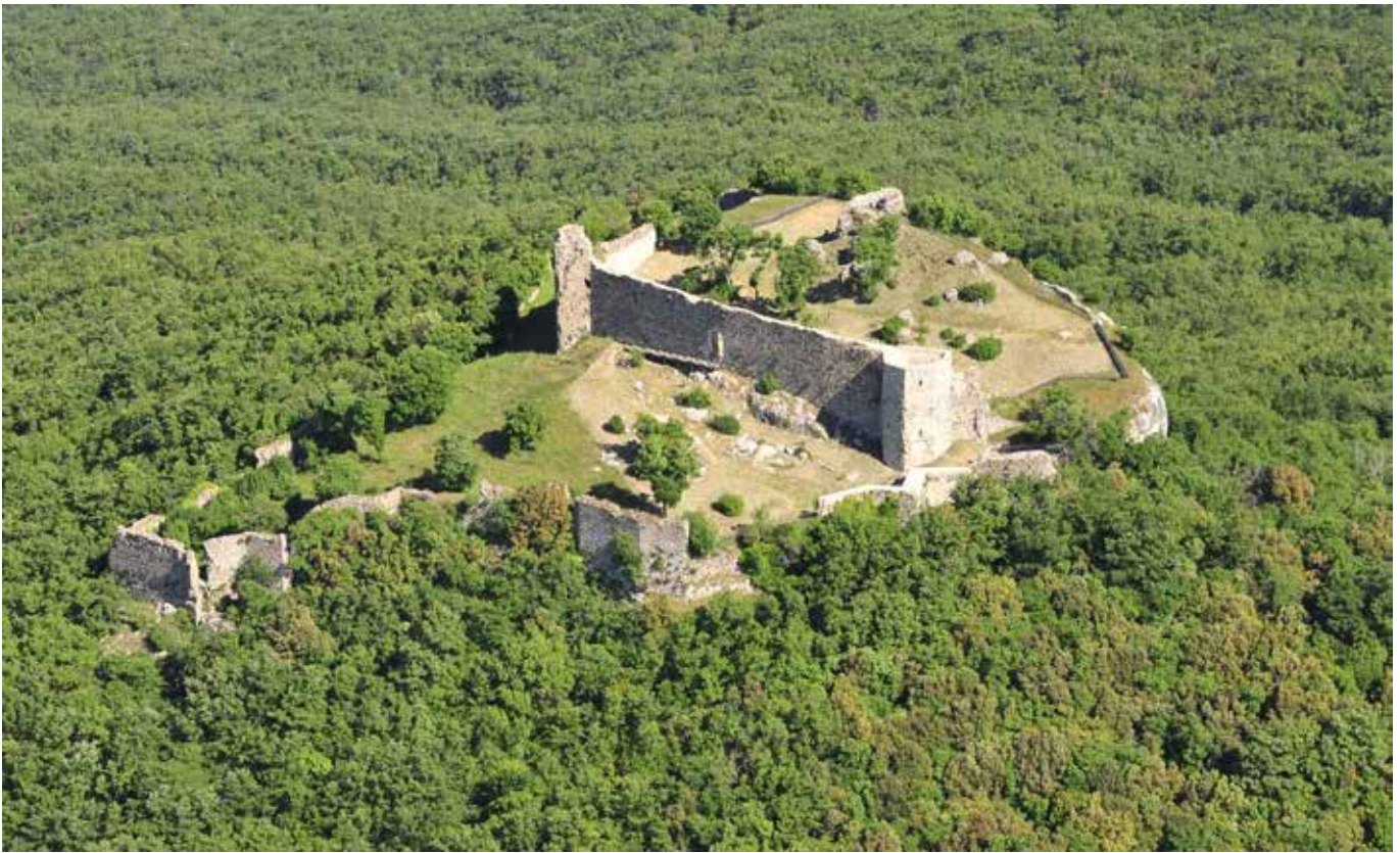
Rocca di Pietrasacca – Lajatico (Pi)