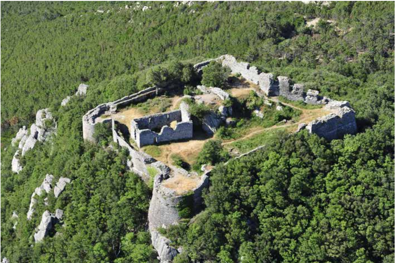
La Verruca – Calci (Pi)