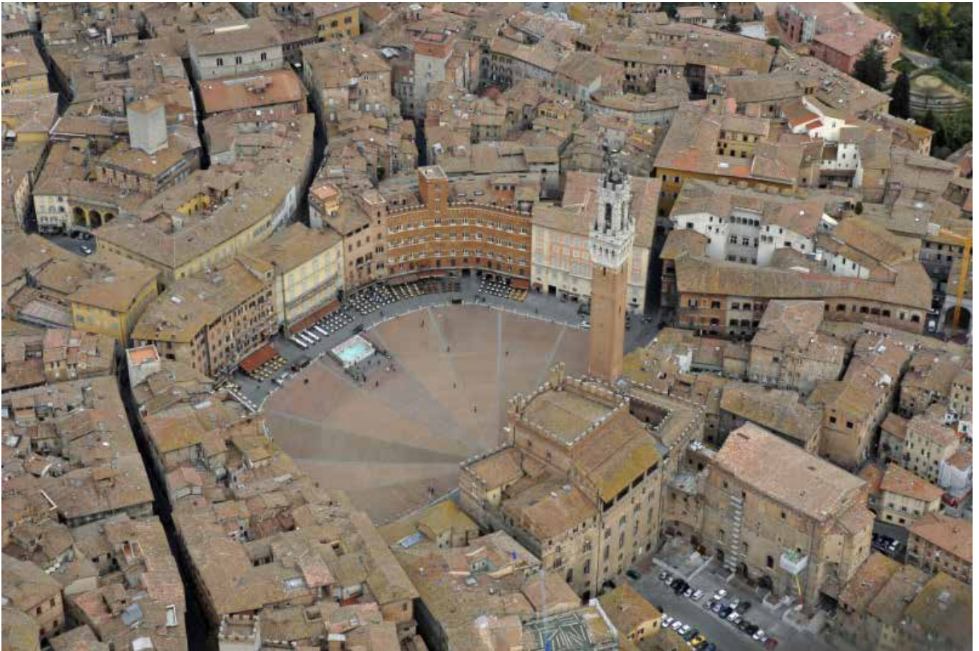
Piazza del Campo – Siena