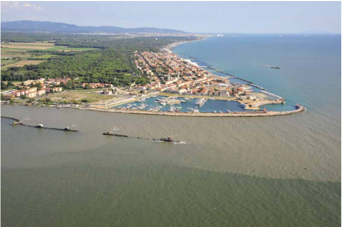
Bocca d'Arno – Porto di Marina di Pisa