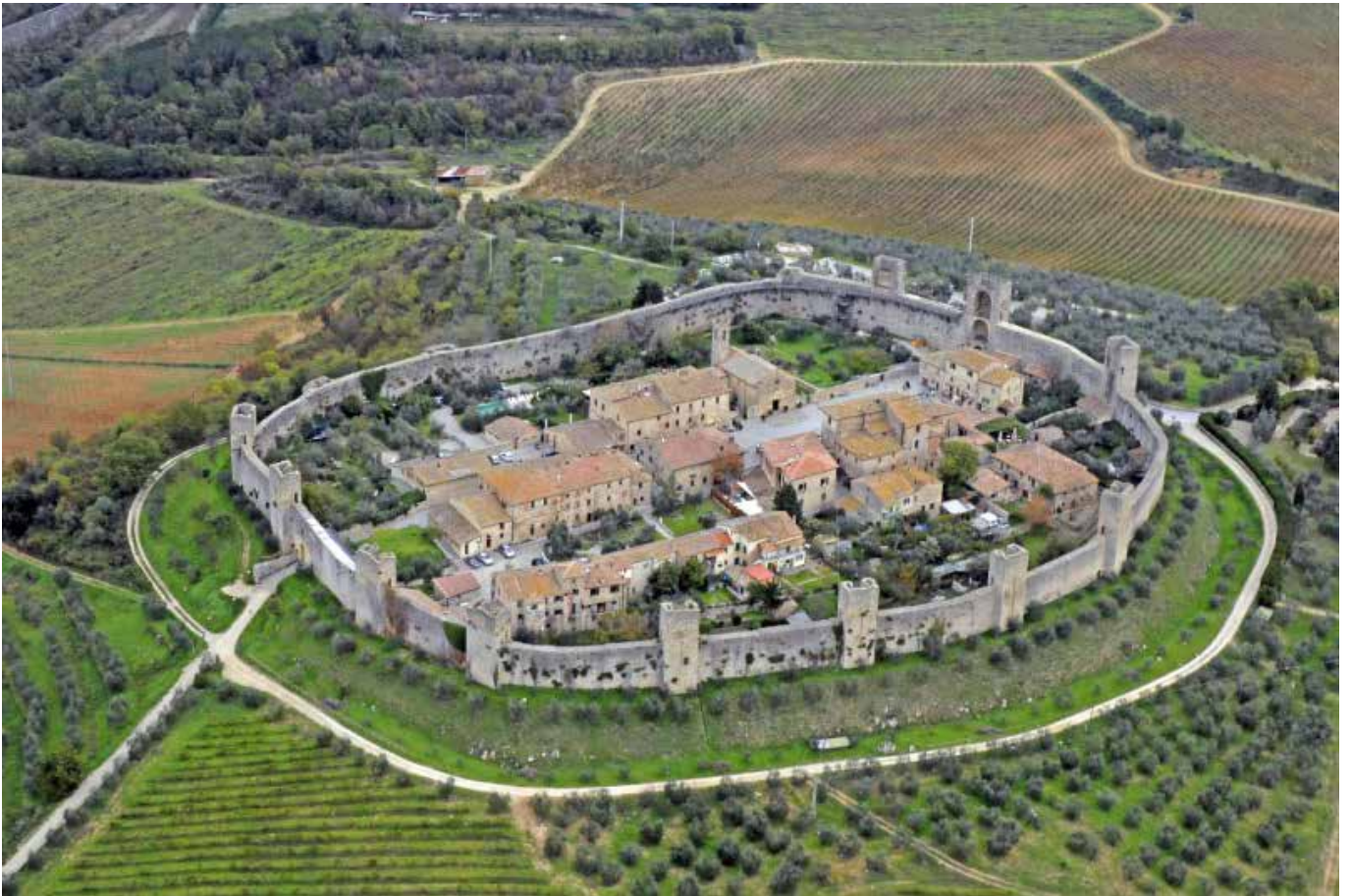
Monteriggioni – Siena