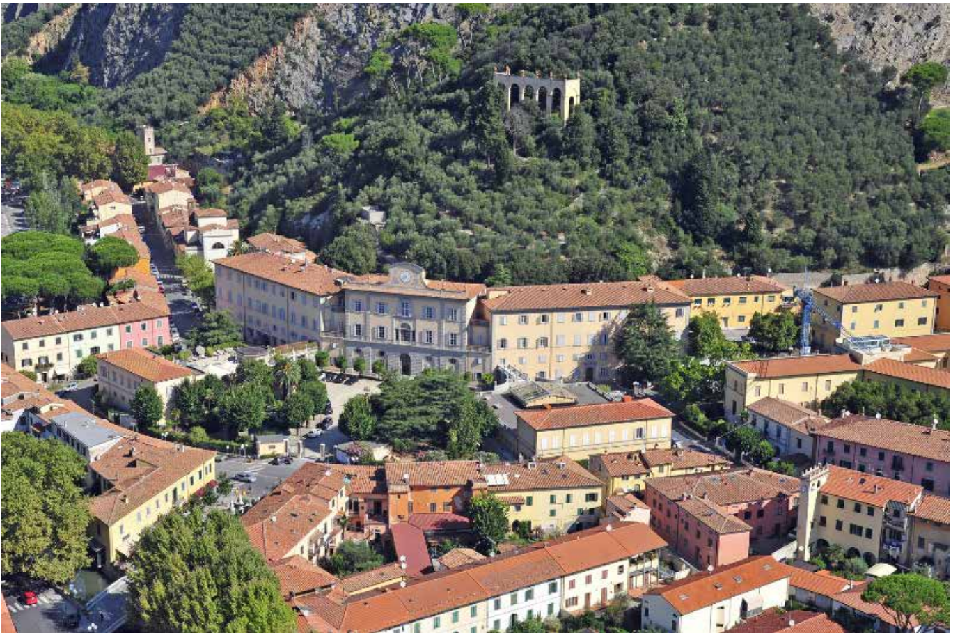
Centro termale – San Giuliano terme (Pi)