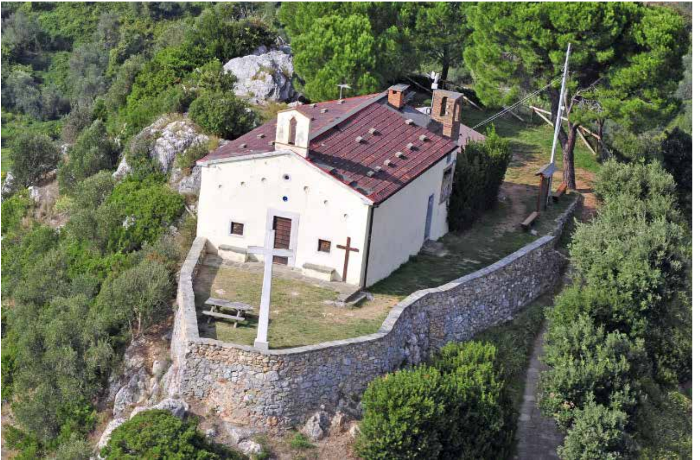
Oratorio di Santa Croce in Castellare – San Giovanni alla Vena (Pi)