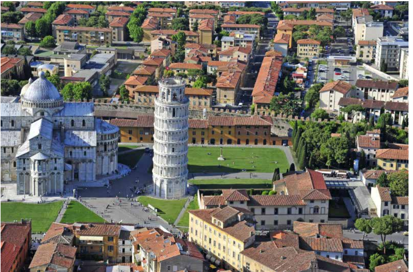
Piazza dei Miracoli – Pisa