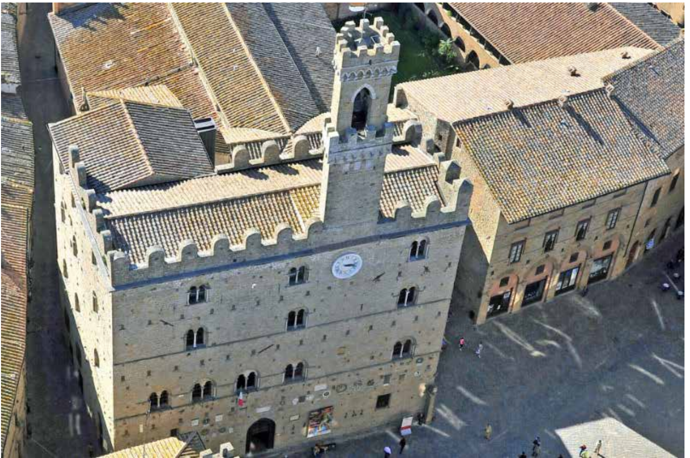
Palazzo dei Priori – Volterra (Pi)