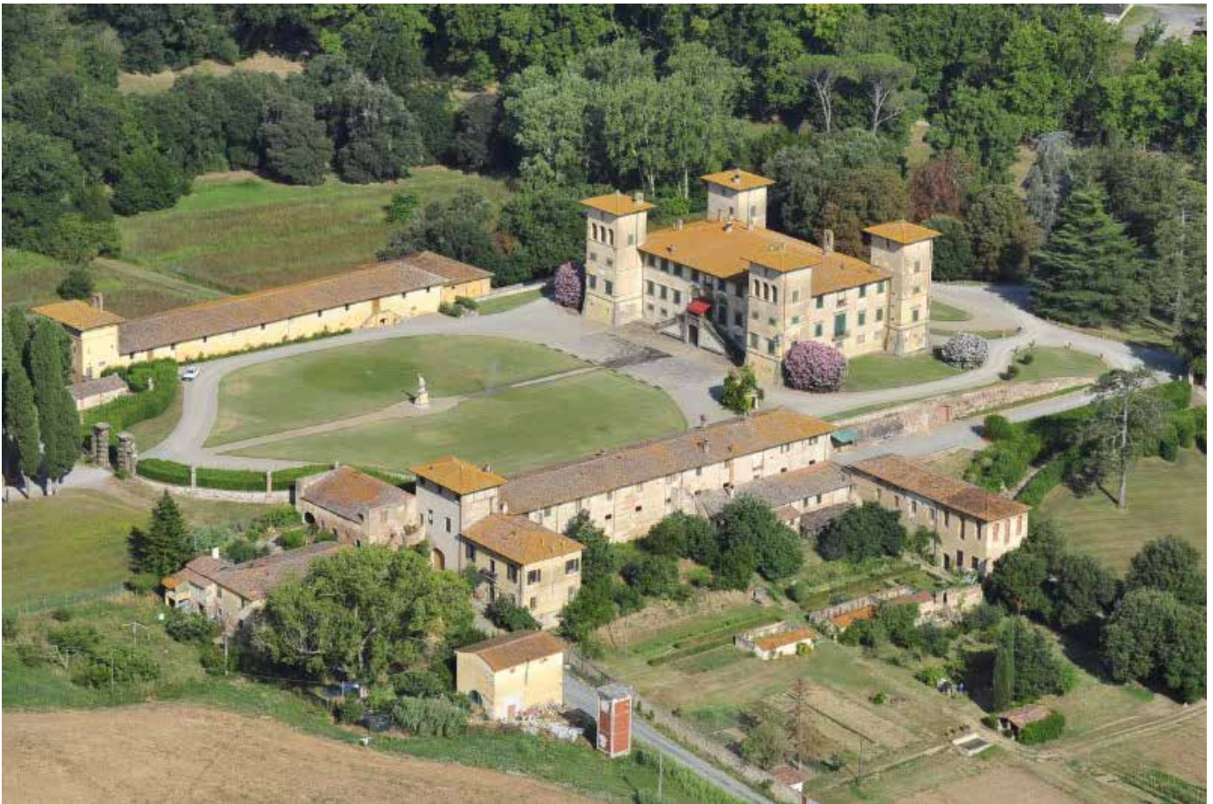
Villa Niccolini – Ponsacco (Pi)