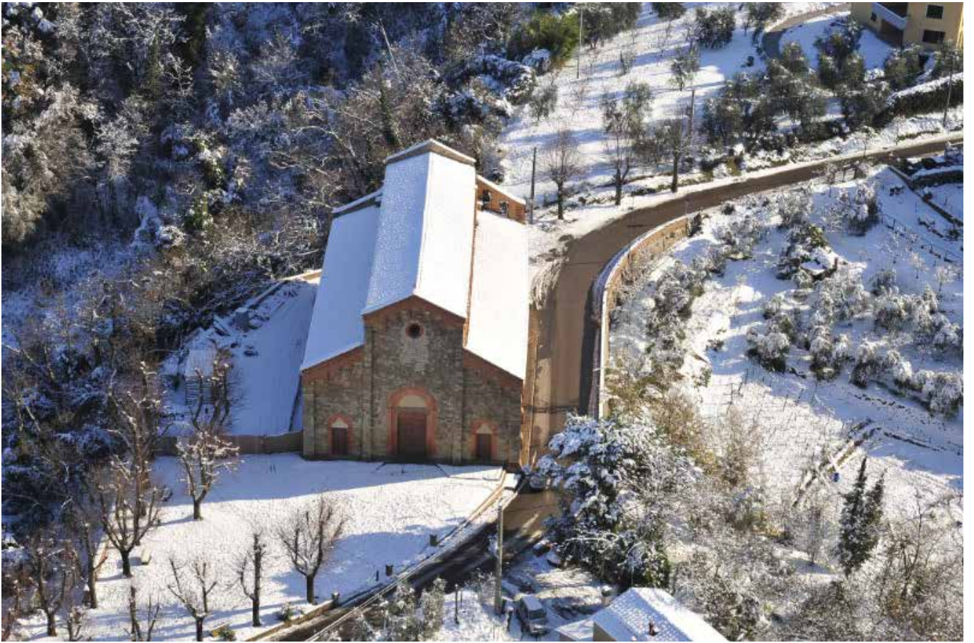
Pieve San Martino – Palaia (Pi)