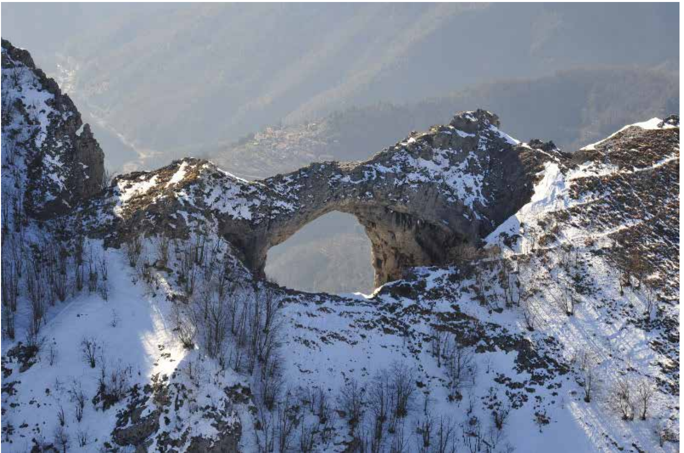
Monte Forato – Apuane (Lu)