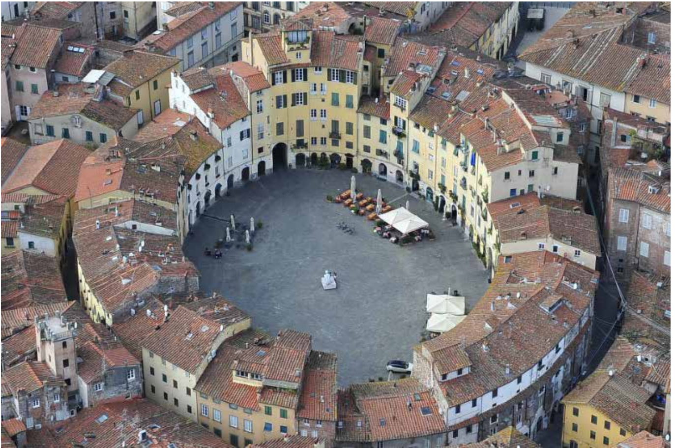
Piazza Anfiteatro – Lucca (Lu)