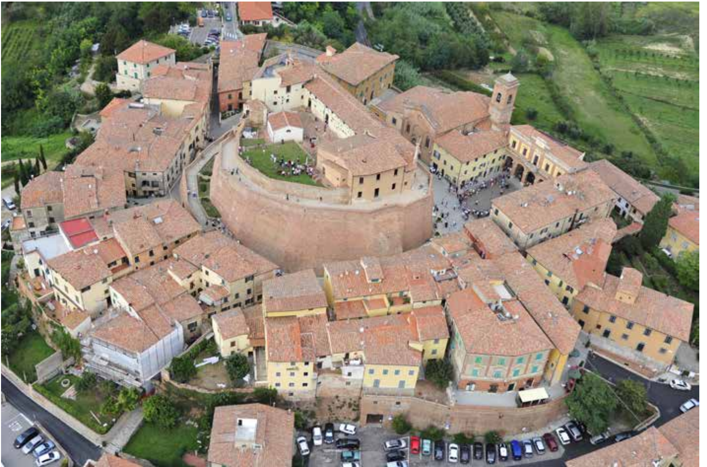
Castello dei Vicari – Lari (Pi)