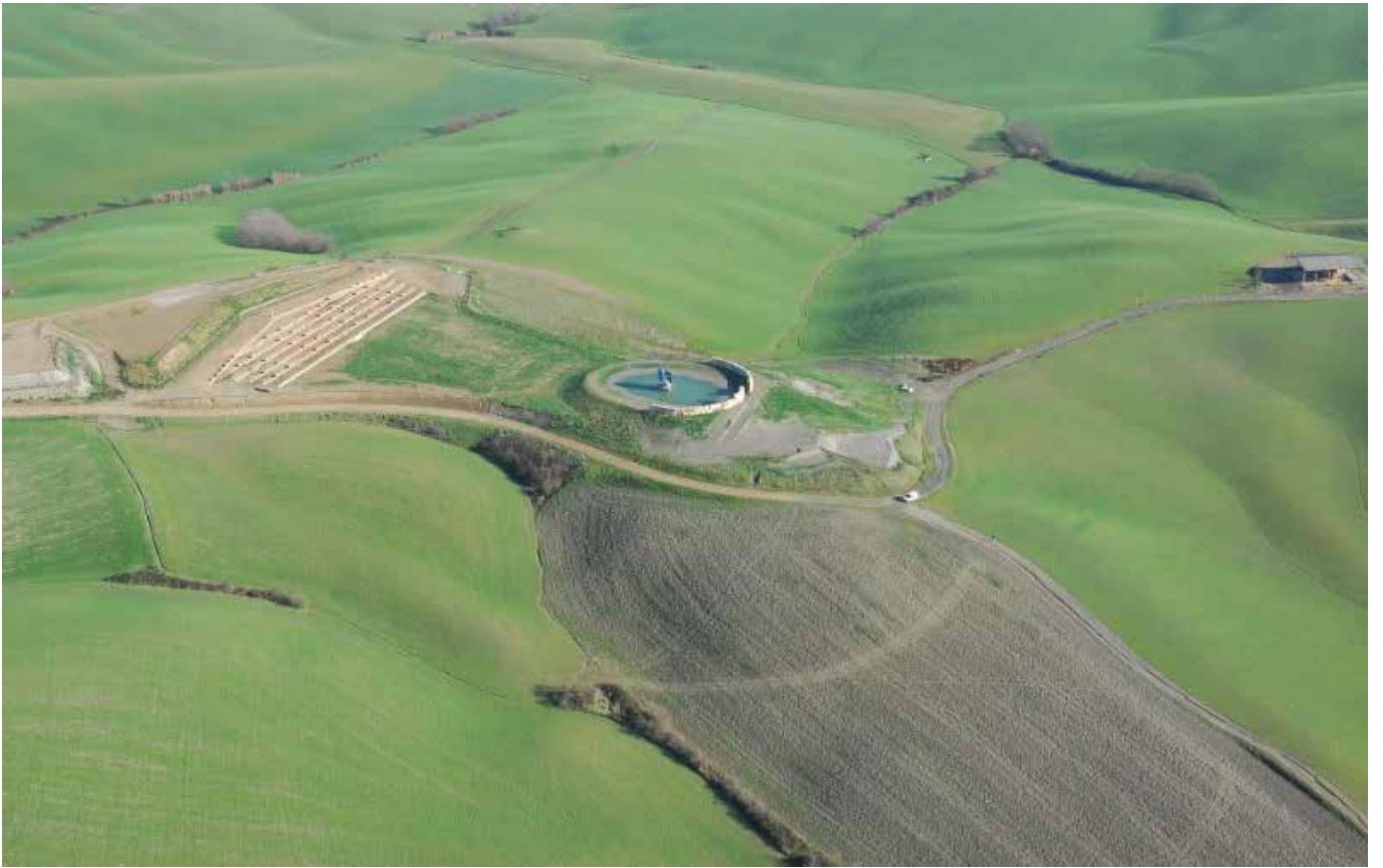
Teatro del Silenzio – Lajatico (Pi)