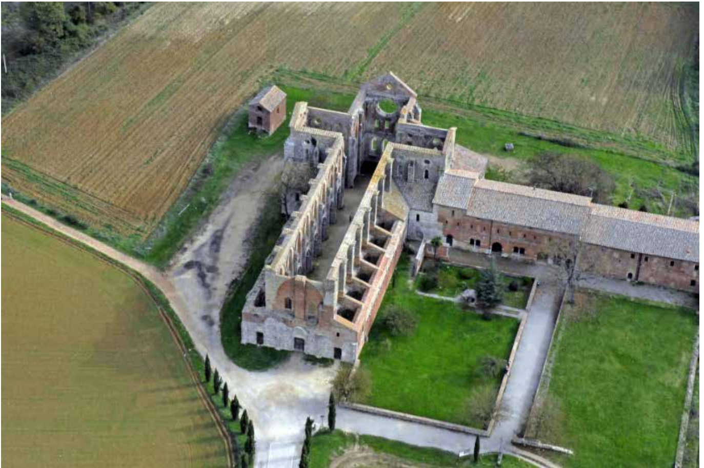
Abbazia San Galgano – Siena