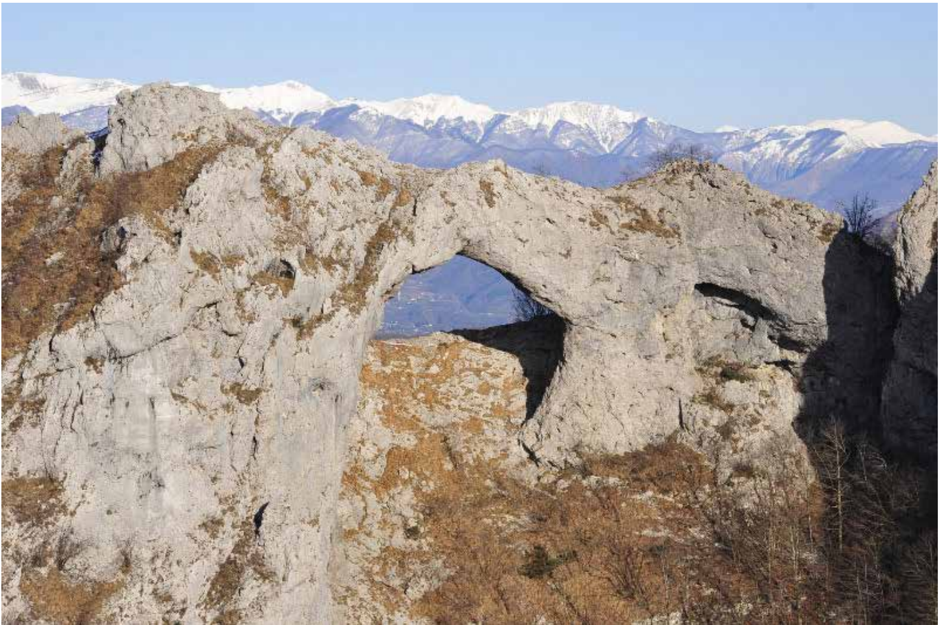
Monte Forato – Apuane (Lu)