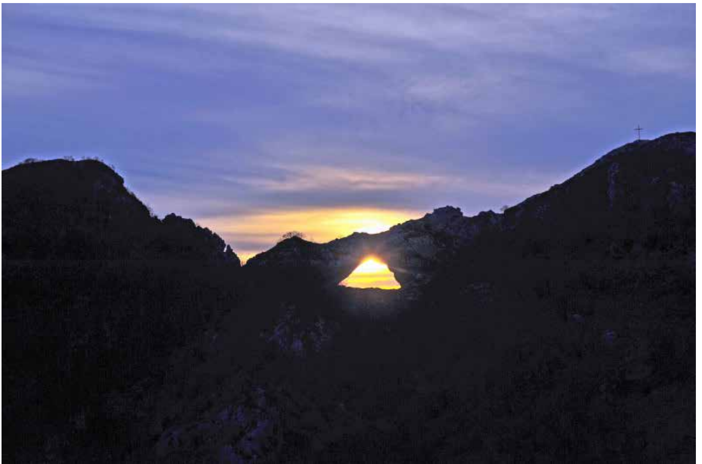
Tramonto al Monte Forato – Apuane (Lu)