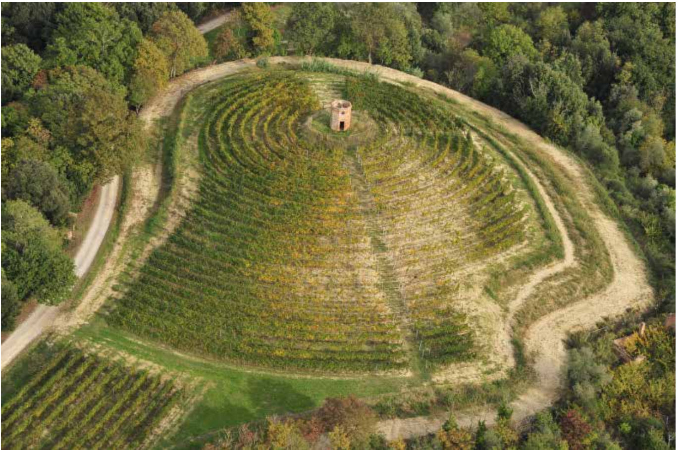
Villa Saletta – Palaia (Pi)