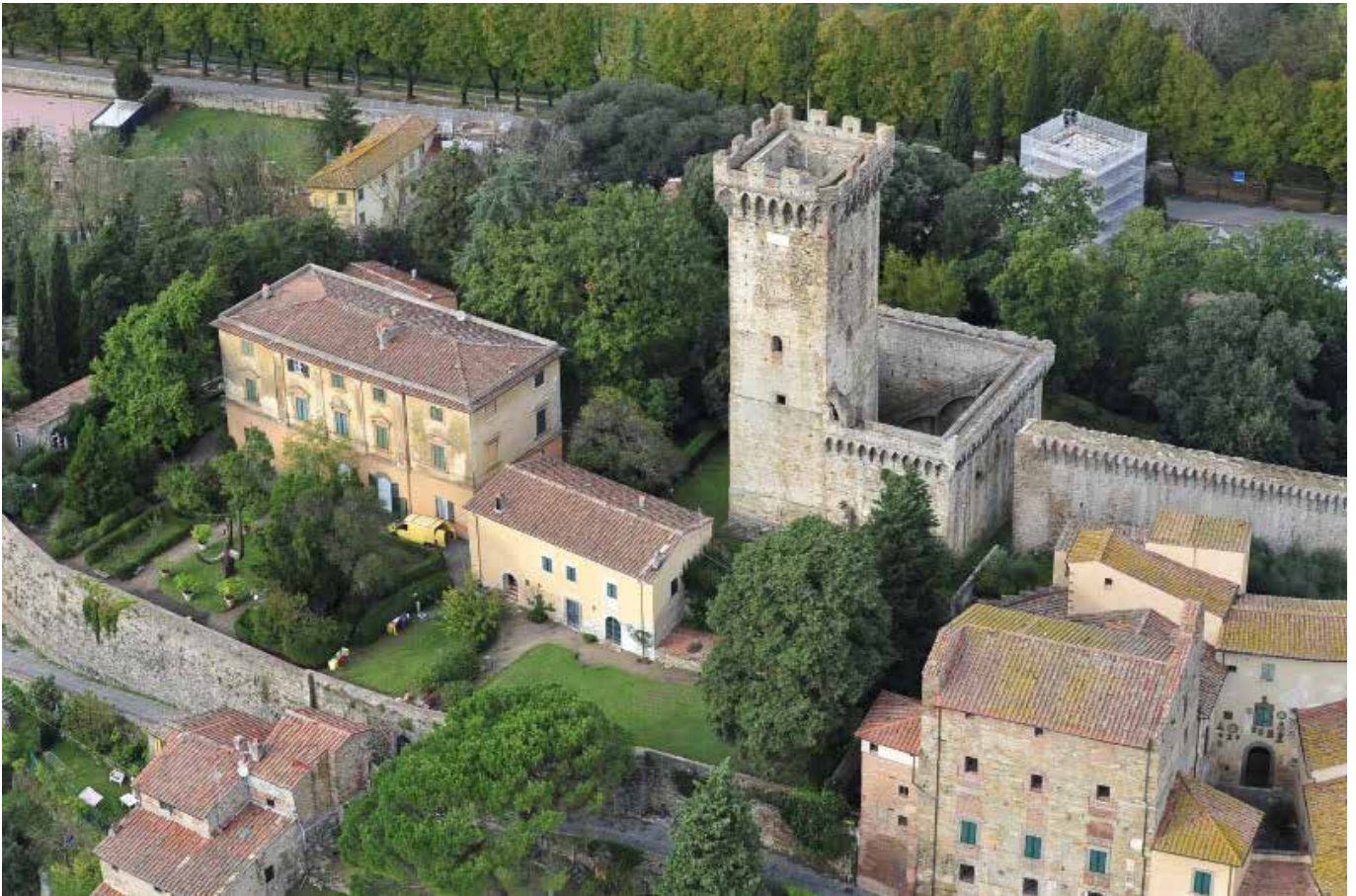
Torre del Brunelleschi – Vicopisano (Pi)