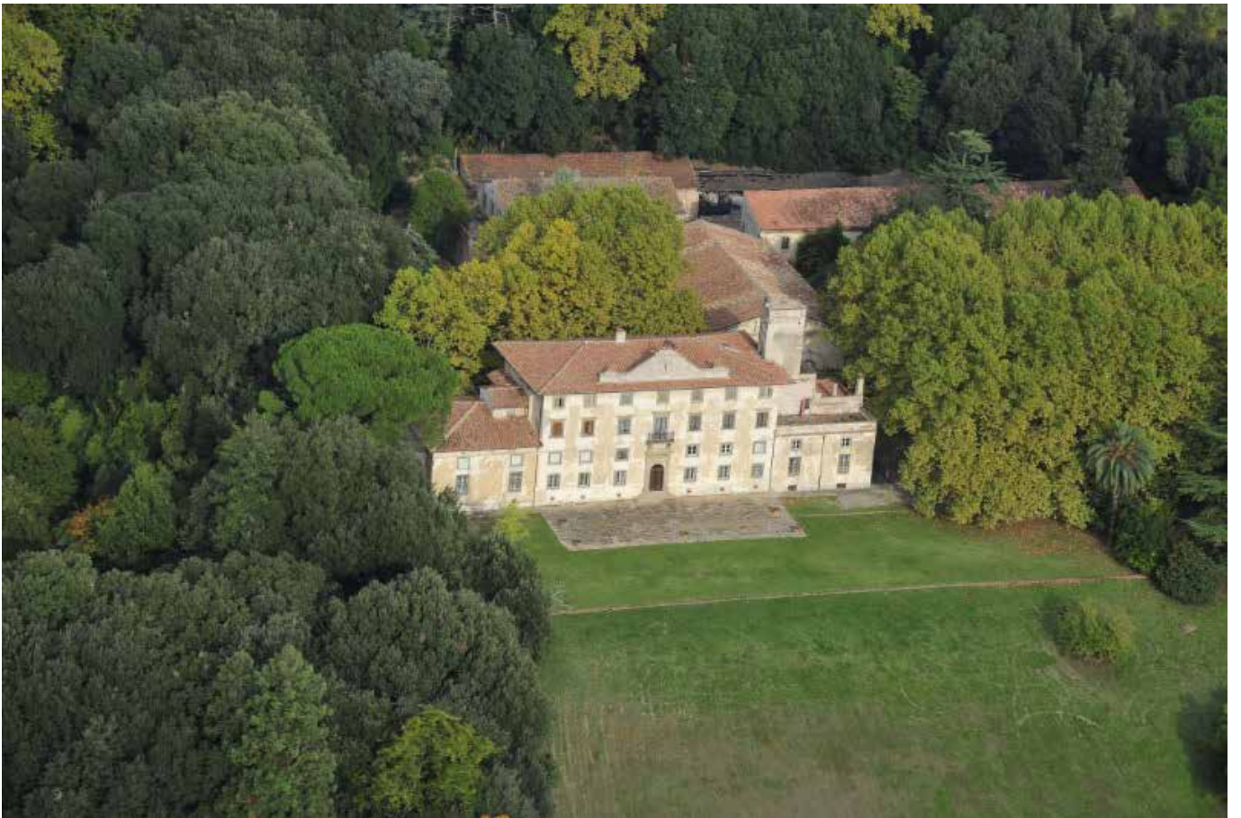
Villa Toscanelli – Val di Cava (Pi)