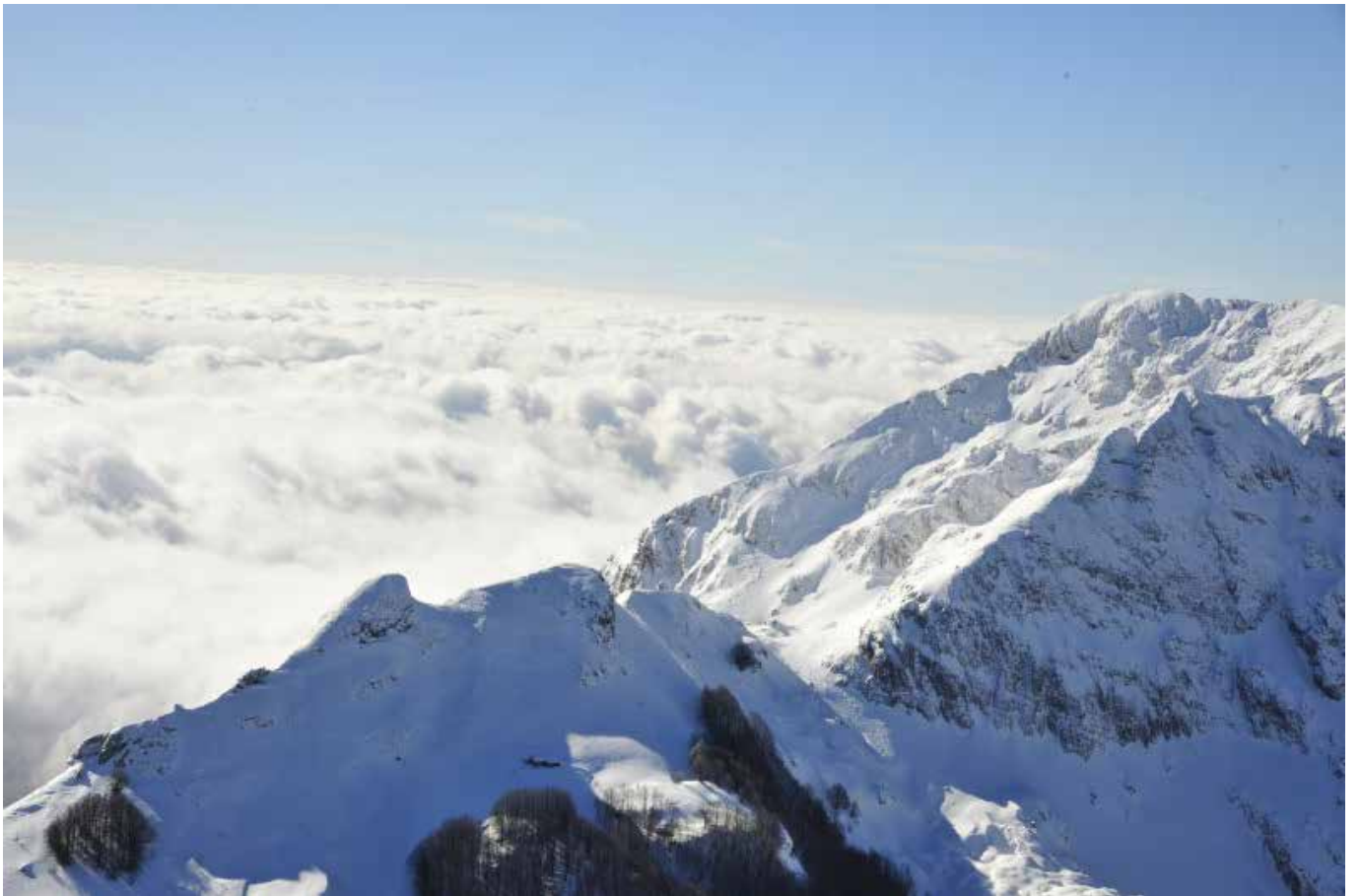
L'Uomo Morto – Apuane (Lu)