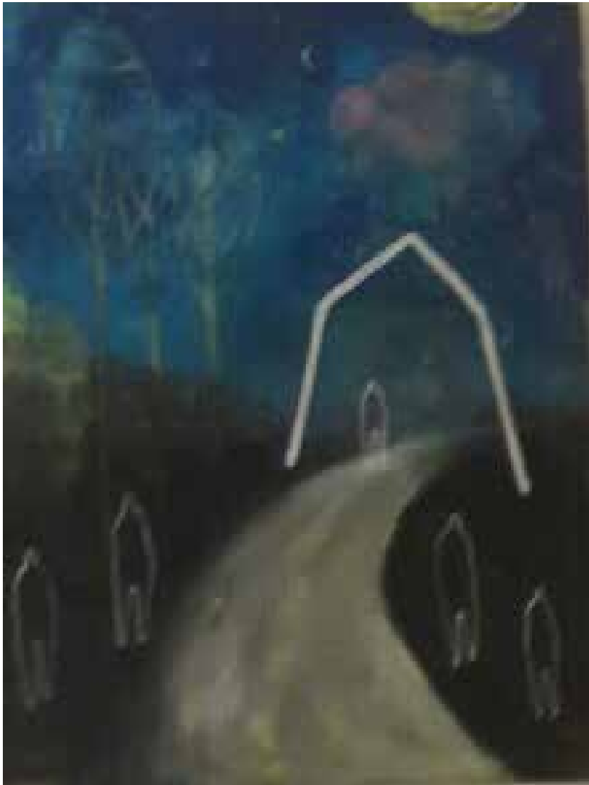
Milena Mladenova, , Bulgaria, 2018, Strada, olio su tela, 50x60