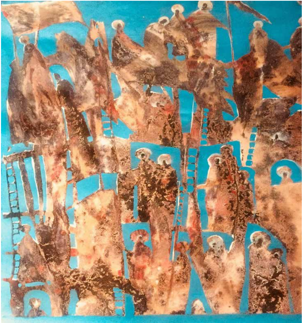
G.Otchuk, Belarus, 2018, Lo spirito di Loreto, olio su tela(tecnica mista), 60x50 cm