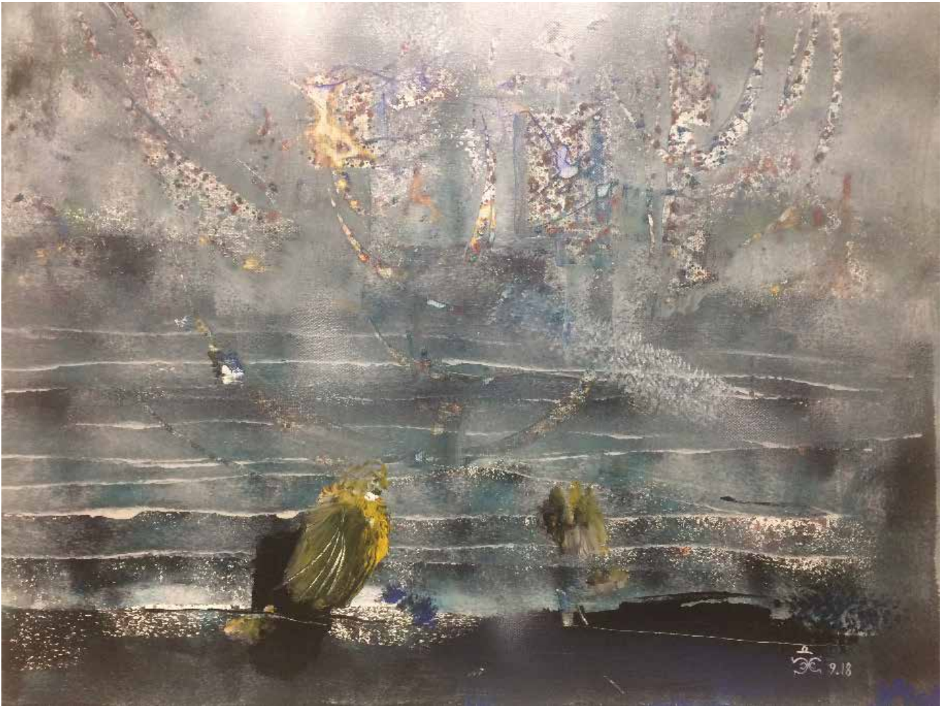
Yuriy Khilko, Belarus, 2018, I ritmi blu, tela, acrilico, 50x60