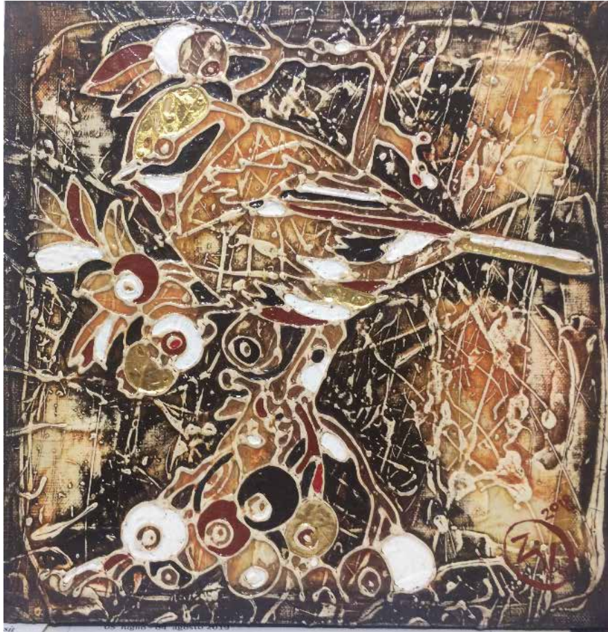
Vasily Zenko, Belarus, 2018, Colazione, tela, acrilico, 30x30