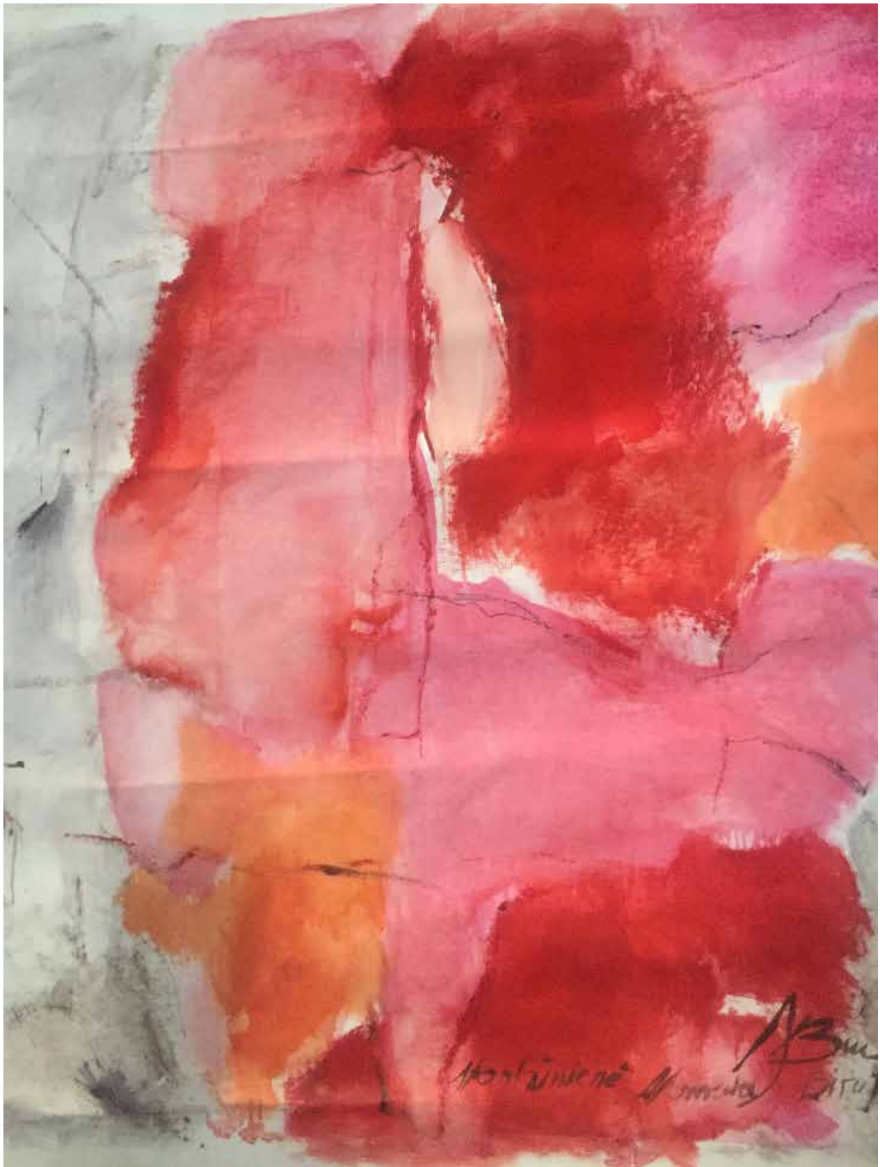
B.N. Stankuniene, Lituania, 2019, senza titolo, olio su tela, 110x120cm