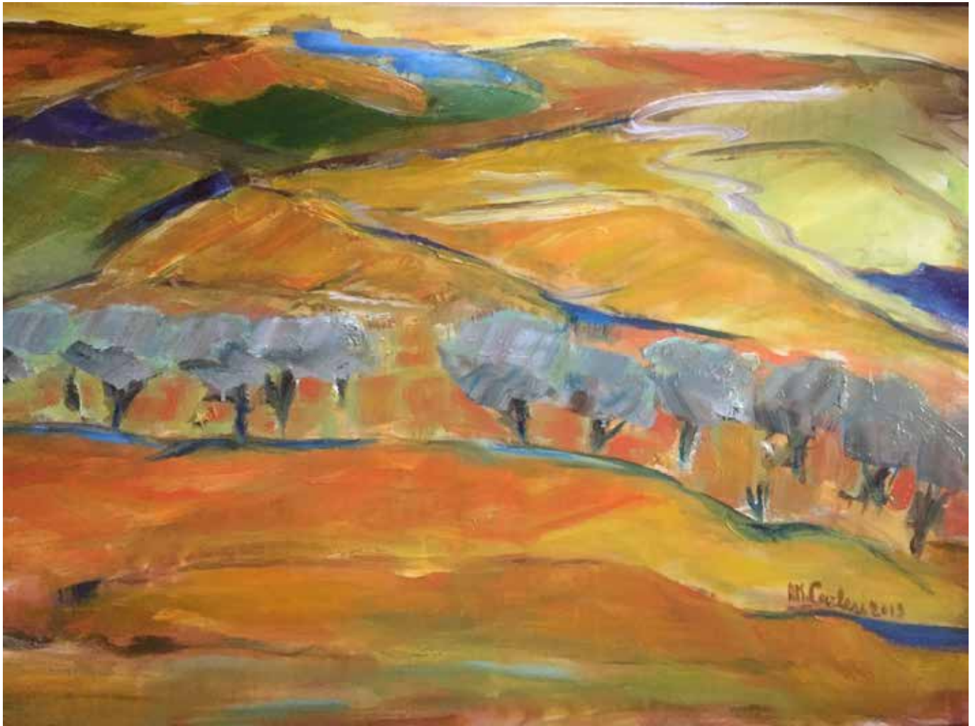
M. Carlesi, Pace Marchigiano, acrilico su tela, 70x90cm