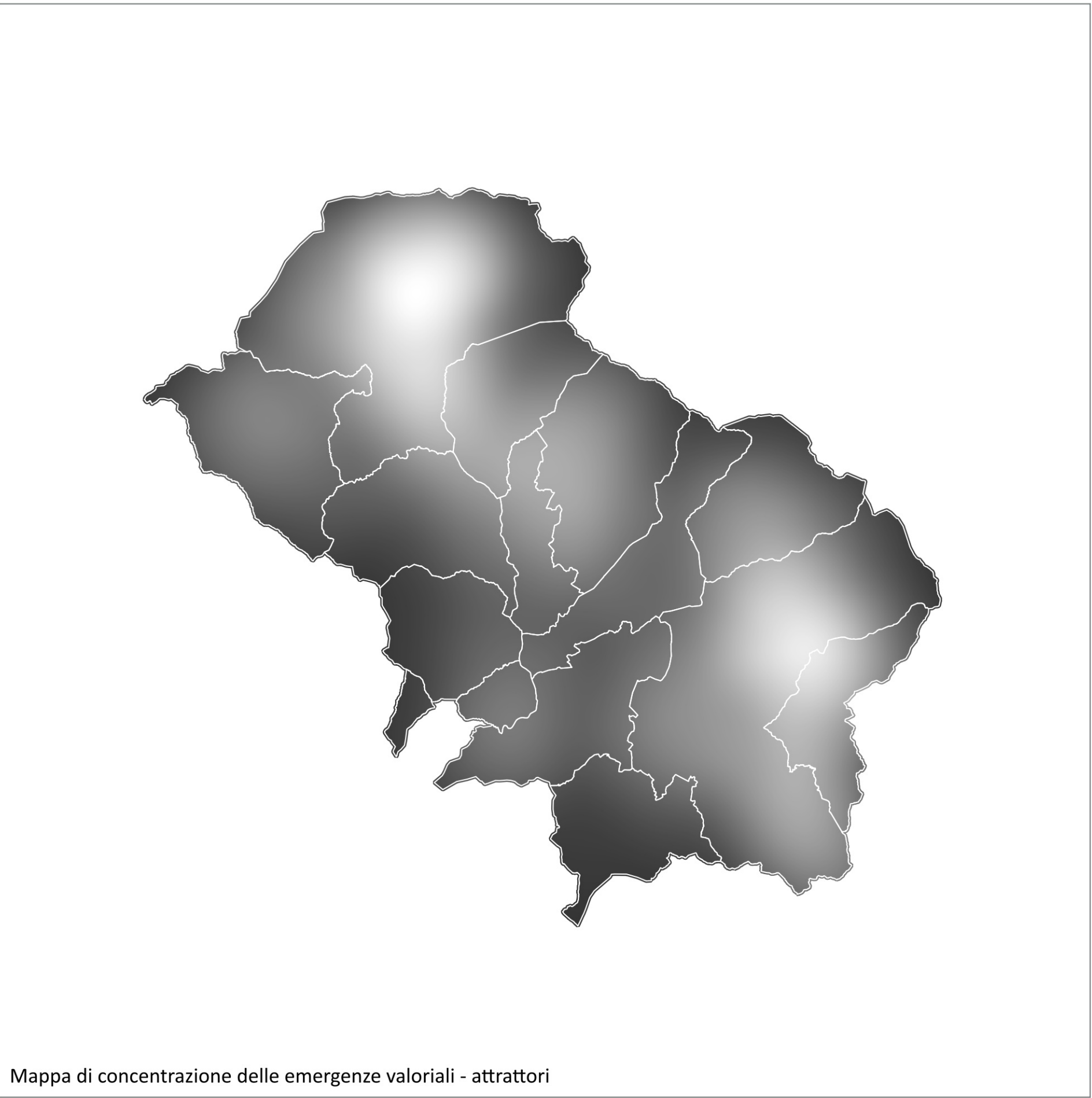
Mapa di concentrazione delle emergenze valoriali - attrattori