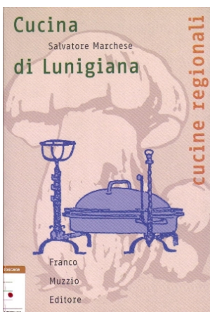
Cucina di Lunigiana , di Salvatore Marchese, Padova, Franco Muzzio Editore, 2004, 307p.

Leggi l' indice [in formato pdf, 369 KB]