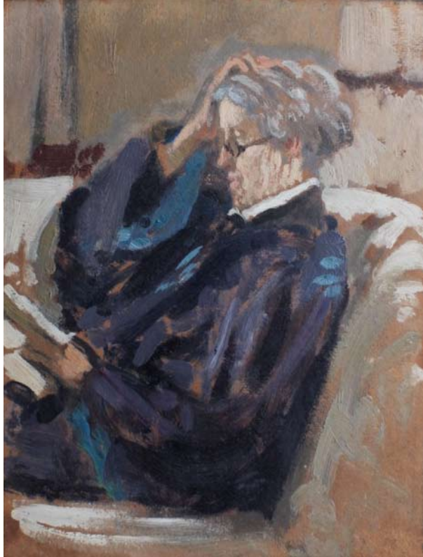
Miss Paget dipinta da Berthe Noufflard, 5 luglio 1931 (per il compleanno di Berthe). Fresnay. Pochade, 21 x 27.