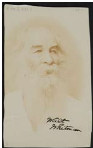
Fig. 1. Walt Whitman. Biblioteca Marucelliana, Firenze