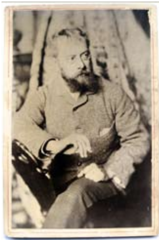
Fig. 3. Telemaco Signorini, 1880

Ma torniamo a Signorini: uomo di raffinata cultura, aduso fin da quando il padre lavorava alla corte del Granduca a sapersi muovere nei salotti dell'alta borghesia e dell'aristocrazia, dove incantava per l'eleganza dei modi e il fascino della complessa personalità, è artista fra i più famosi del momento, fine scrittore di versi e brillante conversatore, ricercato dalle dame dell' upper class per impreziosire la conversazione nei loro salotti. Comprendiamo, dunque, il fascino che egli poté esercitare sulle distinte personalità della colonia anglo-fiorentina, molto incuriosite dai modi eccentrici di questo pittore, in grado di coniugare la serietà dell'impegno artistico a un savoir faire in linea al più evoluto costume sociale, per cui anche Boldini era solito esclamare: "e non abbiamo avuto l'onore di veder spuntare i tuoi guanti gialli e il tuo Chic inglese..."