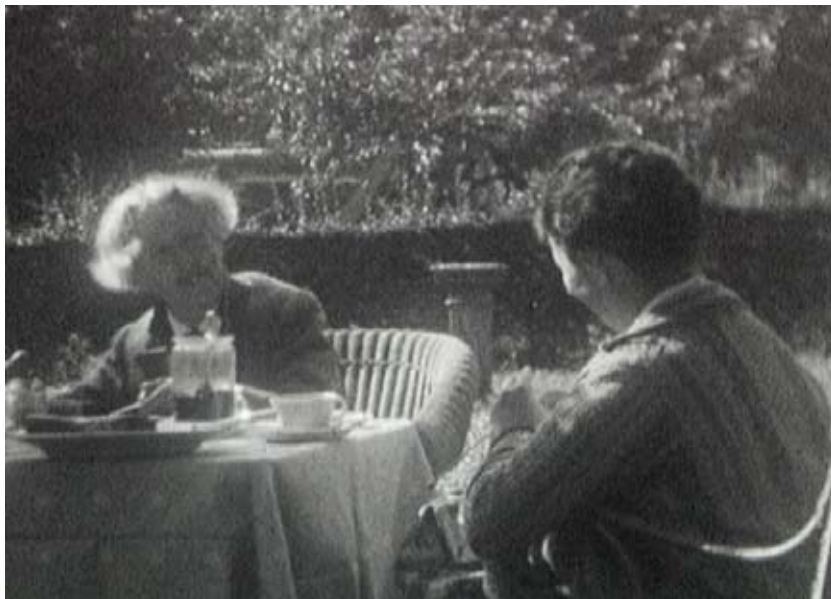
Saint Martin de Boscherville - Fresnay (392) cf photogramme