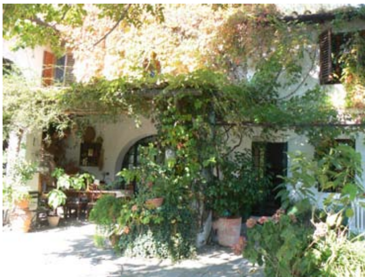
La casa colonica della Villa Il Palmerino, sede attuale dell'Associazione Culturale