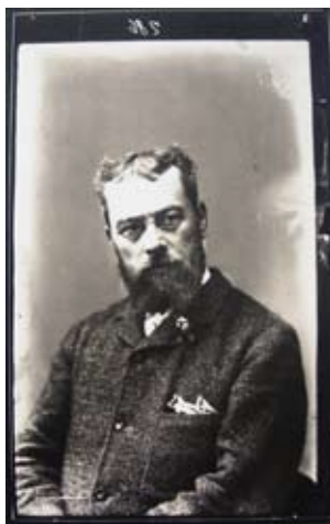
Fig. 4. Telemaco Signorini, 1885 ca.

la quale si interessò alle opere che il pittore esponeva a Venezia nel 1883, o la principessa Gortschakoff, famosa dedicataria dell' Improviso Notturmo di Franz Liszt, che ebbe predilezione per le sue vedute di ulivi dipinte a Settignano.