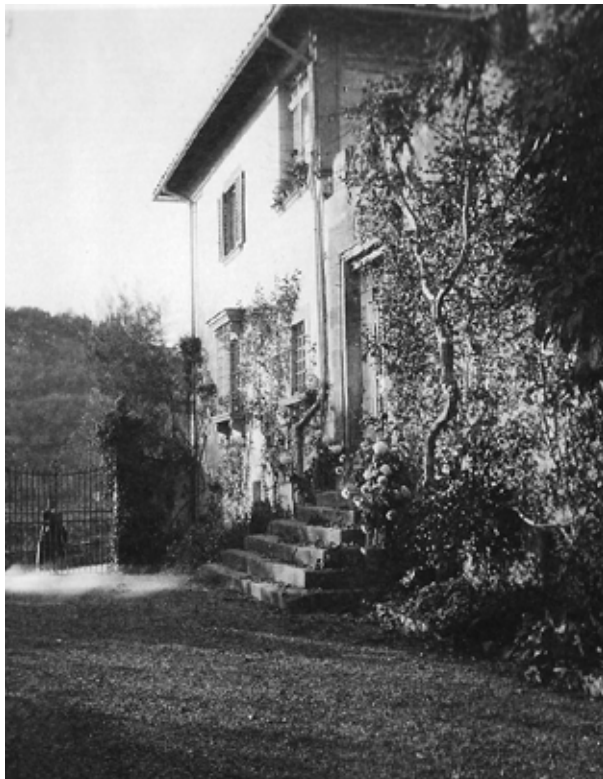
Villa Il Palmerino, 1920 circa, collezione Clementina Anstruther-Thomson. Foto gentilmente concessa dal signor James Owen