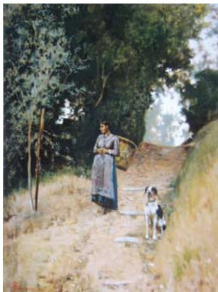
Fig. 5. Telemaco Signorini, Contadina con gerla e cane , 1895; 79 x 59 cm olio su tela