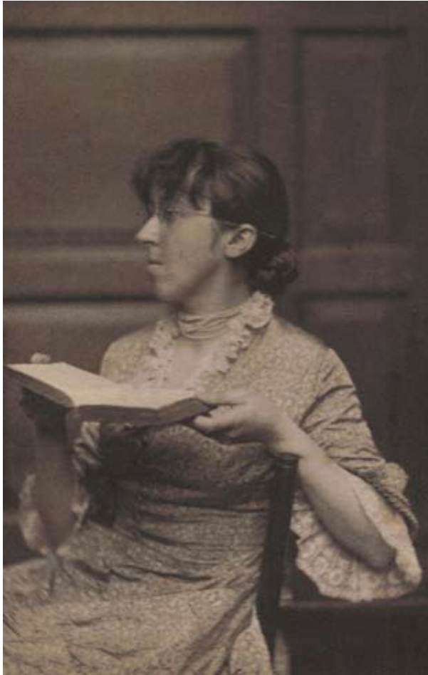
Vernon Lee, 1885 ca. Collezione privata, Firenze