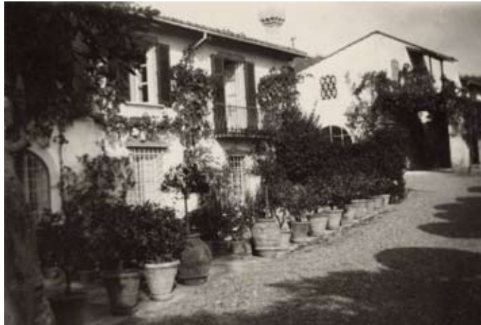
Villa Il Palmerino e casa colonica nel 1930 ca.