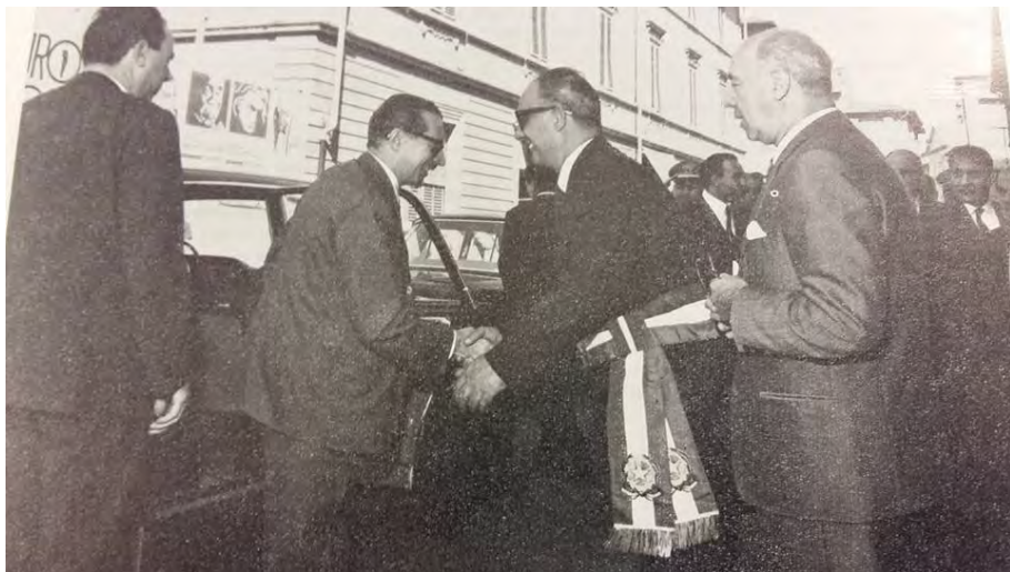
Metà anni '60, visita a Empoli del ministro del Bilancio Giovanni Pieraccini, che si interessò dei problemi dell'edilizia scolastica cittadina. A accoglierlo, con la fascia tricolore, il sindaco Mario Assirelli

Il 4 agosto fu invece il ministro del Bilancio Giovanni Pieraccini a informare Assirelli di aver contattato il sottosegretario di Stato alla Pubblica Istruzione, Pietro Caleffi, “per una sollecita, se possibile, favorevole definizione della pratica di contributo intestata a codesto Comune.”