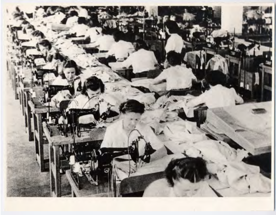
Interno di una confezione con lavoro a catena, anni '60

Per alleviare le fatiche delle donne lavoratrici occorre una svolta sul piano delle riforme sociali finalizzate a garantire una mitigazione del peso dell'inscindibilità tra dimensione privata e professionale. Era necessario rafforzare quanto già fatto nell'ambito del cosiddetto "sistema educativo pubblico per la prima e la seconda infanzia", vale a dire asili nido e scuole materne.