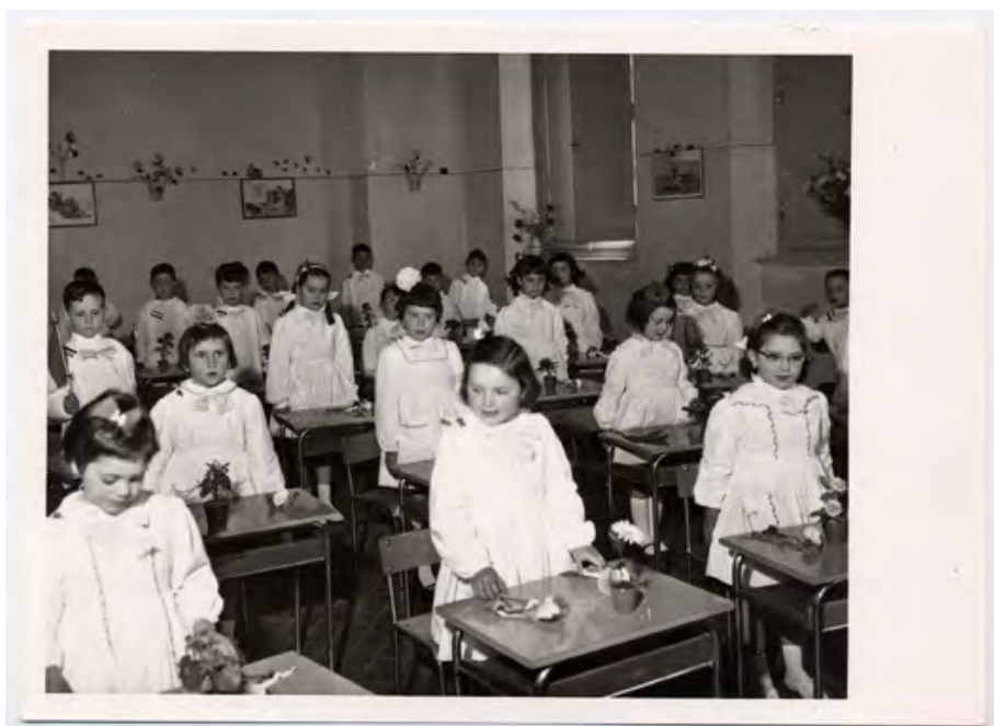
Interno di una scuola elementare empolesse degli anni '60

deficienze si riscontravano anche negli edifici scolastici del capoluogo. Urgeva, pertanto, provvedere in un primo tempo a costruire un edificio per le scuole elementari nelle frazioni che ne erano prive curando, però, contemporaneamente anche un miglioramento agli edifici del capoluogo. La spesa sostenuta a tale uopo è molto rilevante in quanto supera 177 milioni e tale spesa è stata sostenuta nella massima parte esclusivamente dal Comune, poiché non si è potuto ottenere dallo Stato, nonostante pressanti sollecitazioni, che il contributo del 4 o 5% sull'importo di L. 51.500.000. 45