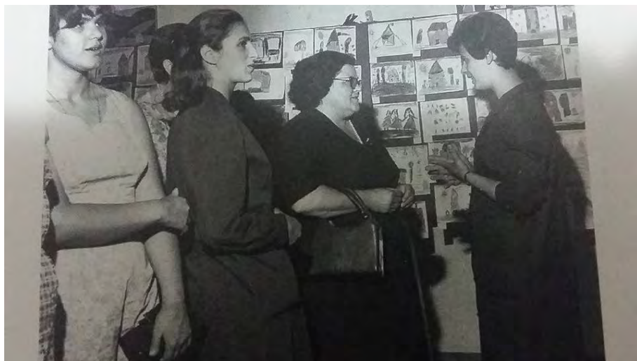
L'assessore Giovanna Salvadori in visita a una scuola materna comunale, 1968

Tra il 1968 e il 1969, in base alle statistiche, la "Primavera" contava 264 iscritti, la "Peter Pan" 142 e la "Collodi" 42, per un totale di 448 bambini frequentanti le scuole materne comunali, a cui andavano aggiunti i 96 delle sezioni statali di Piazza XXIV Luglio, per un totale di 544 50