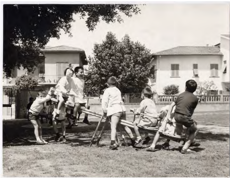
Giardino della scuola materna comunale del capoluogo, anni '60

Per valutare la situazione e il decoro degli edifici adibiti a scuole risultano preziose le informazioni contenute nelle relazioni finali sul funzionamento della scuola materna. Al termine dell'a.s. 1968/69- ad esempio- la scuola di Monterappoli aveva lamentato alcune problematiche tecniche tra sedie da aggiustare, campanello che non funzionava, finestre inadeguate per dare aria e rendere l'ambiente luminoso, materiale didattico carente e necessità di installare il telefono, vista l'intenzione di molte famiglie di avere una linea telefonica casalinga. 51